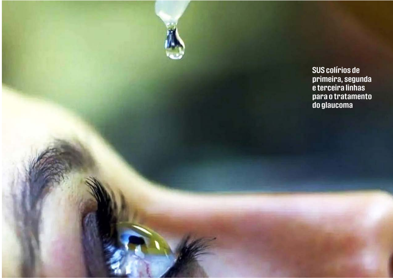
SUS colírios de primeira, segunda e terceira linhas para o tratamento do glaucoma

“Entre janeiro de 2019 e dezembro de 2023, o atendimento oferecido pelos médicos oftalmologistas na rede pública beneficiou esse grupo de pacientes com acesso gratuito a tratamentos medicamentosos. Esse fluxo revela o impacto positivo da assistência oftalmológica no SUS