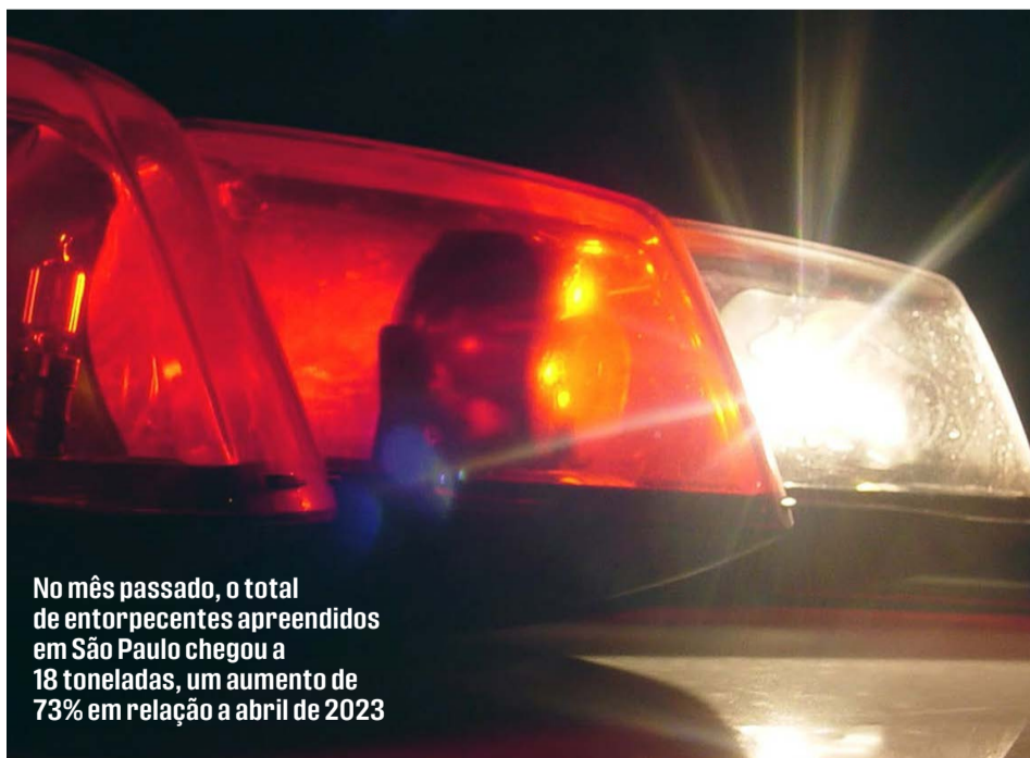
No mês passado, o total de entorpecentes apreendidos em São Paulo chegou a 18 toneladas, um aumento de 73% em relação a abril de 2023

Conforme levantamento da Secretaria da Segurança Pública, o total apreendido representa um impacto financeiro de quase R$ 140 milhões no crime organizado. No mês passado, o total de entorpecentes apreendidos em São Paulo chegou a 18 toneladas, um aumento de 73% em relação a abril de 2023. Só de maconha foram quase 8,5 toneladas