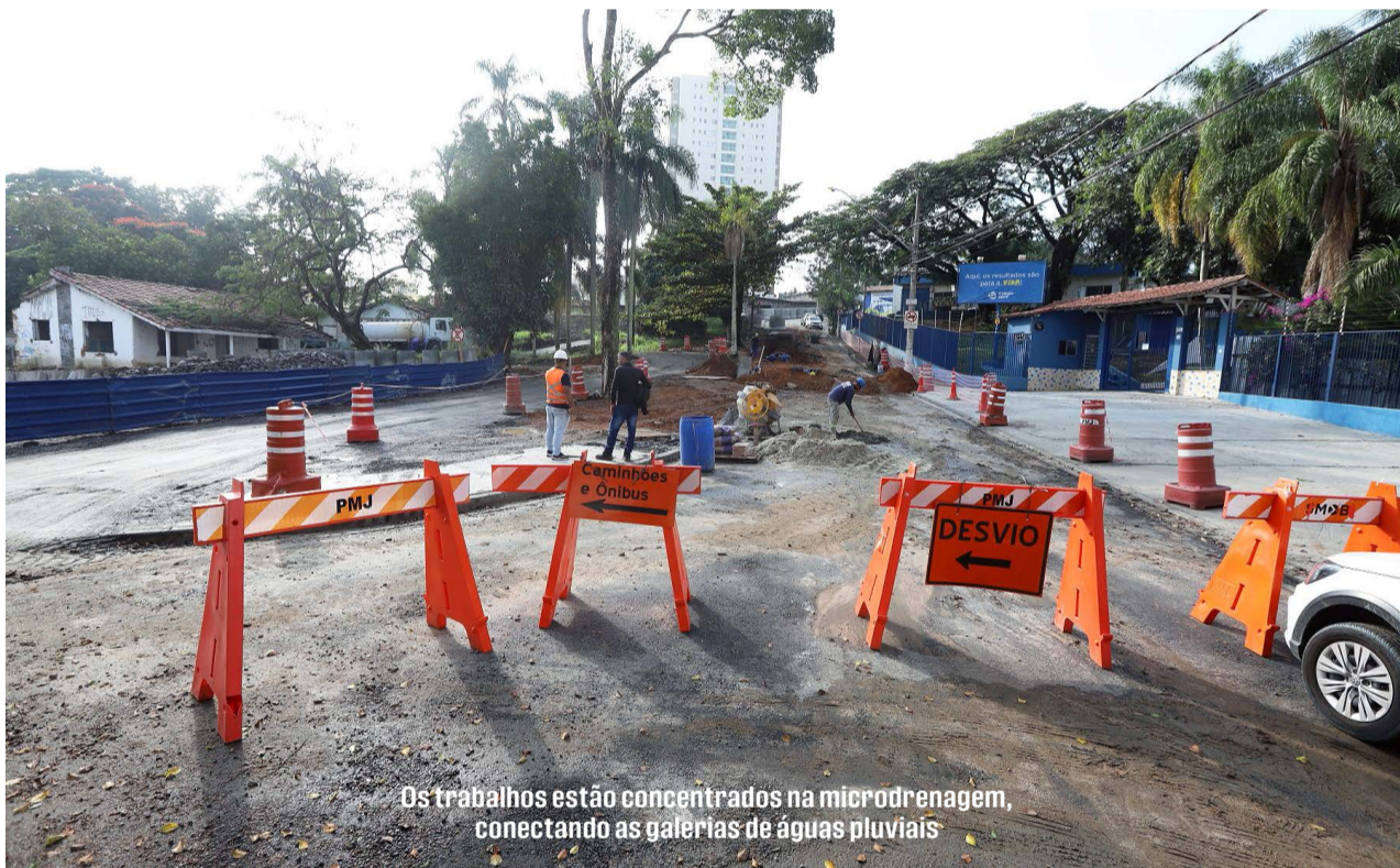
Os trabalhos estão concentrados na microdrenagem, conectando as galerias de águas pluviais

A Prefeitura Municipal informou que a Rua Irajá, no Jardim Luiza (região leste), está interditada entre a Rua Iracema e a Rua Santa Cruz, para a fase final das obras de drenagem no bairro. Para garantir a fluidez no trecho, um desvio provisório em frente ao Colégio SEPP está em operação neste período.