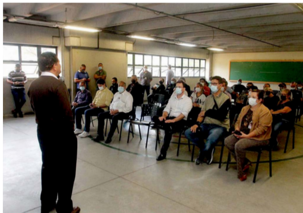
O prefeito Izaias Santana (PSDB) fala com moradores

Na época, a atual administração afirmou que o encontro foi 'elucidativo' e com apresentação de mapas, slides e detalhamento das obras que seriam executadas posteriormente pela empresa vencedora do processo licitatório. Moradores também puderam tirar dúvidas, fazer apontamentos e sugestões,