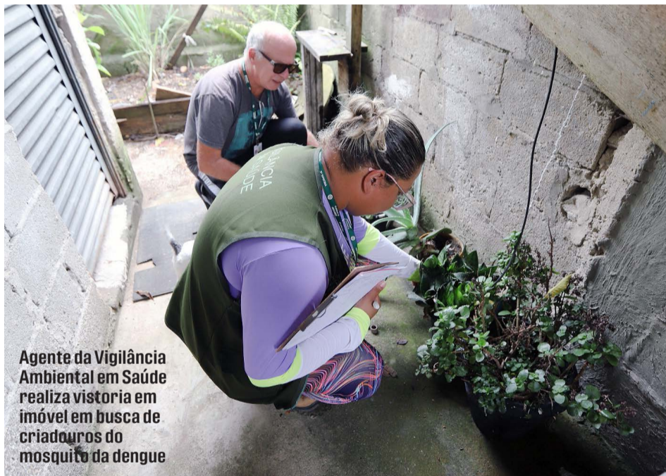
Agente da Vigilância Ambiental em Saúde realiza vistoria em imóvel em busca de criadouros do mosquito da dengue

De acordo com a atual administração, a equipe da Vigilância Ambiental em Saúde realizou vistorias nos imóveis em busca de criadouros do mosquito Aedes aegypti .