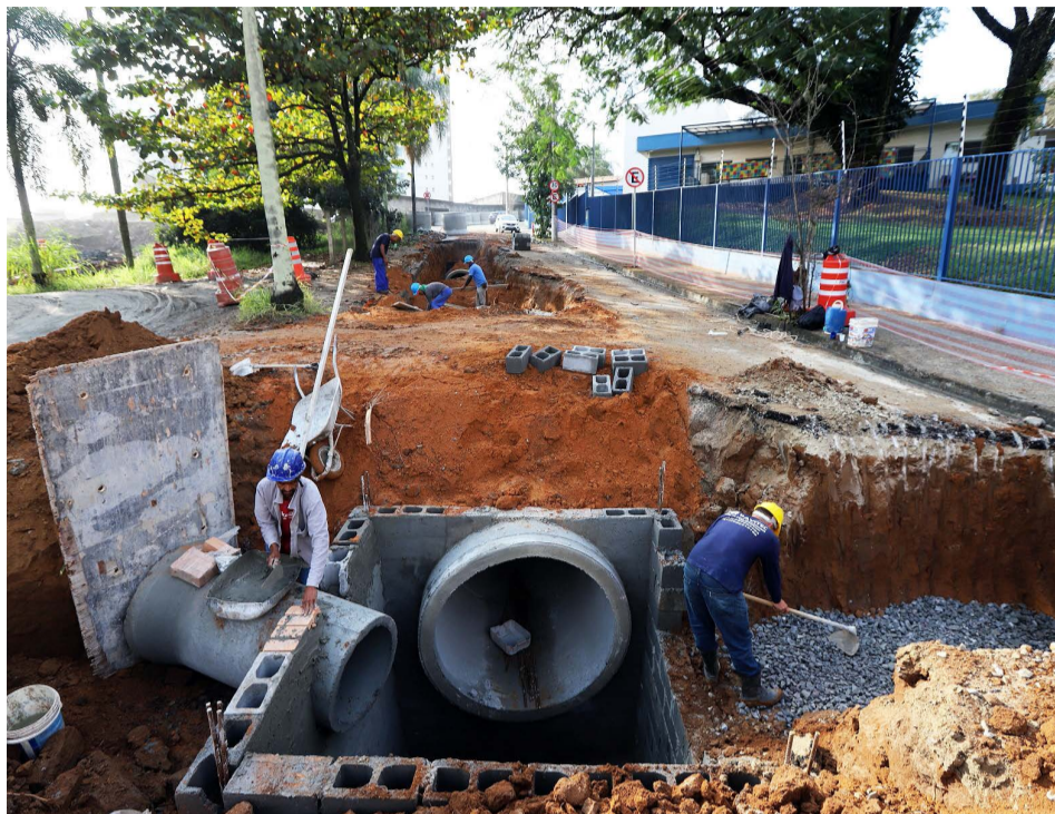
Os trabalhos estão concentrados na microdrenagem, conectando as galerias

“A parte mais complexa da obra já foi toda finalizada, com mais de 600 metros de galeria,