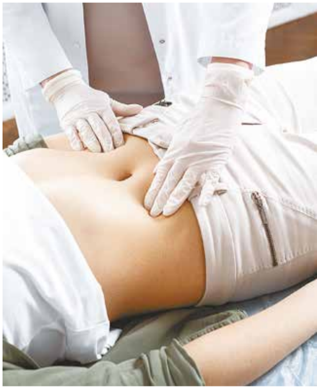
MAIOR PARTE DOS ADULTOS TEM OU TERÁ PÓLIPOS NO INTESTINO