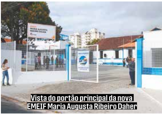
Vista do portão principal da nova EMEIF Maria Augusta Ribeiro Daher