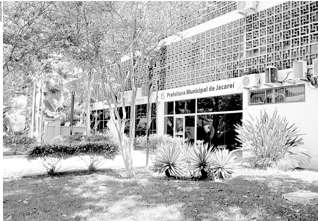
As inscrições para o concurso da Prefeitura de Jacaré terão início às 8h deste sábado (5) e seguirão até o dia 24 de agosto

As vagas contemplam candidatos que possuam