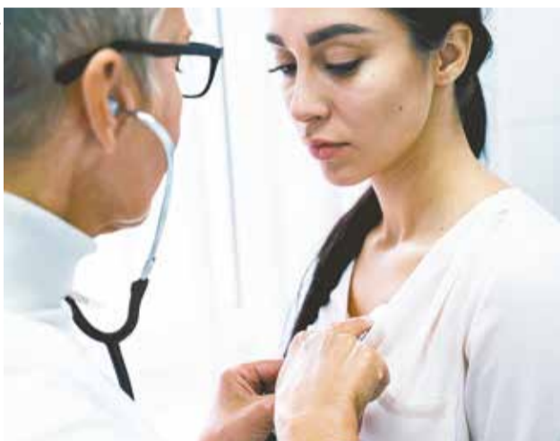
A DOENÇA INDEPENDENTE DA IDADE, ETNIA E SEXO

A CMH afeta uma das áreas do músculo do coração, causando uma hipertrofia, o que prejudica a passagem adequada do sangue. A doença acontece quando há um bloqueio causado pelo espessamento do músculo cardíaco, que reduz o fluxo sanguíneo para fora do órgão. A CMH afeta pessoas independentemente da idade, etnia e sexo. Na maioria dos casos a causa