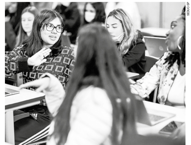
O aprofundamento é escolhido pelo estudante na 1ª série e cursado durante as 2ª e 3ª séries do Ensino Médio

O aprofundamento é escolhido pelo estudante na 1ª série e cursado durante as 2ª e 3ª séries. Também há inserção de disciplinas comuns que são cursadas por todos os alunos a partir da 1ª série: Educação Financeira, Projeto de Vida, Redação e