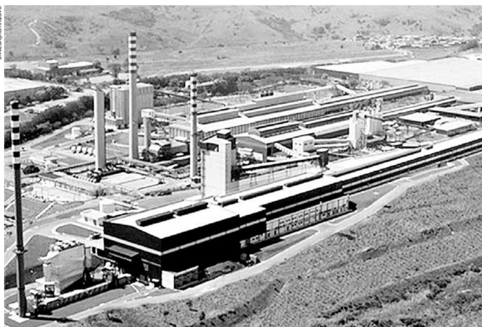
Vista geral da unidade da fabricante de vidros Cebrace, no Parque Califórnia, em Jacareí

É a primeira vez que uma usina de vidro plano brasileira anuncia o uso do biometano na produção, uma fonte energética renovável e sustentável,