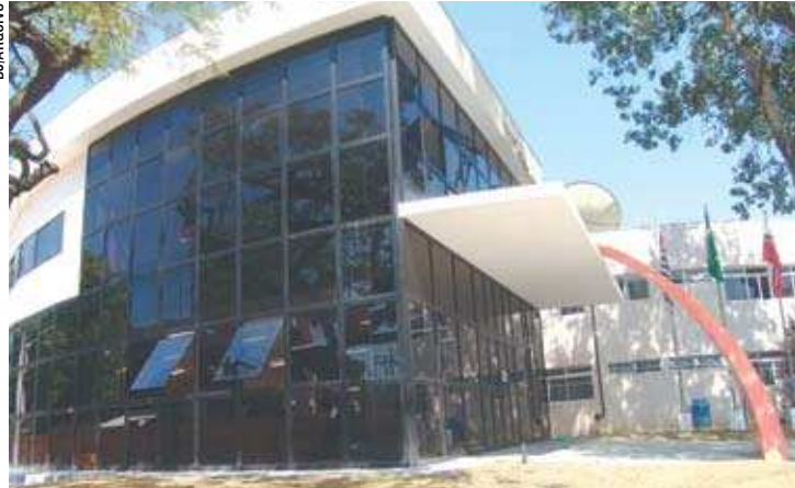
O anexo da Câmara foi inaugurado em novembro do ano passado e consumiu R$ 2,1 milhões

ANEXO - O prédio anexo da Câmara de Jacaréi foi inaugurado em novembro de 2010, após dois anos em obra e em meio a investigações do Ministério Público. A obra, que