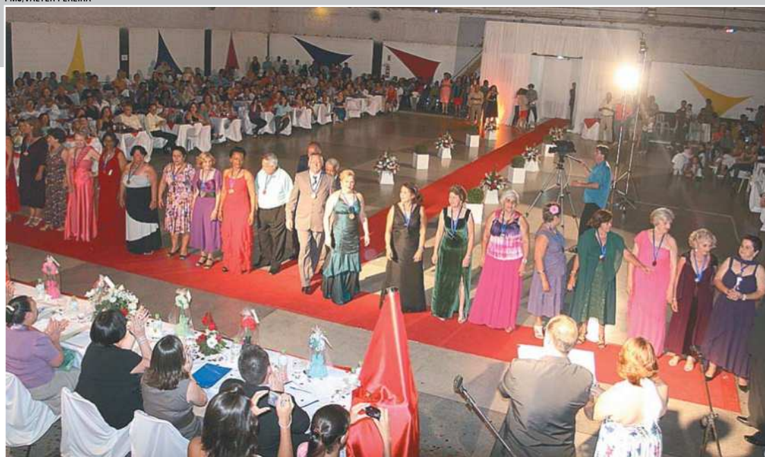
Elegância e charme tomaram conta do clube Ponte Preta durante o concurso