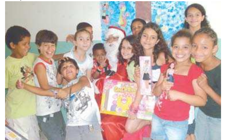
Ao longo de quatro edições, o projeto da operadora de saúde já alegrou centenas de crianças com presentes natalinos