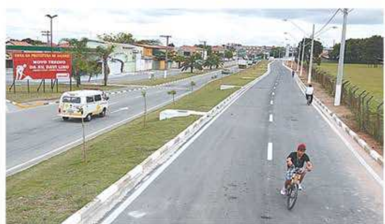
Segunda etapa da avenida Davi Monteiro Lino irá dar mais fluidez ao trânsito para quem entra e sai da cidade

A partir deste sábado (26), várias mudanças estão sendo realizadas em Jacaréi: são alterações no transporte coletivo, com a chegada de mais oito ônibus para a frota; reprogramação de paradas e mudanças no trajeto dos ônibus urbanos e intermunicipais. Tudo isso, para adequar a malha viária ao crescimento de Jacaréi, que já não suporta mais o tráfego atual.