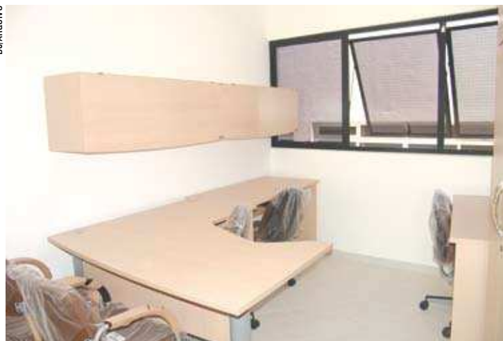
A compra do mobiliário para os novos gabinetes, no valor de R$ 1,015 milhão foi alvo de investigação por parte do Ministério Público Estadual

ficou paralisada por 14 meses até uma nova licitação, foi comandada pela construtora Suzuki Engenharia e Construção Ltda., de Mogi das Cruzes, e consumiu quase R$ 2,1 milhões – R$ 300 mil a mais que o previsto.