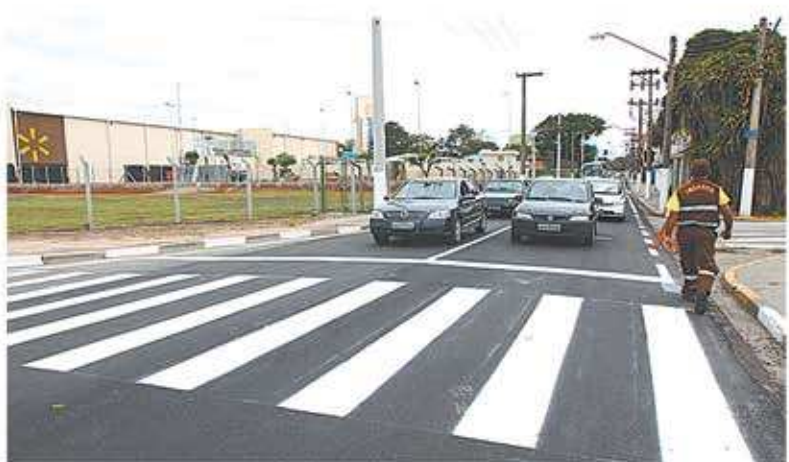
Rua JB Duarte, na Vila Pinheiro: via passa ser importante corredor de trânsito para quem quiser acessar à nova avenida