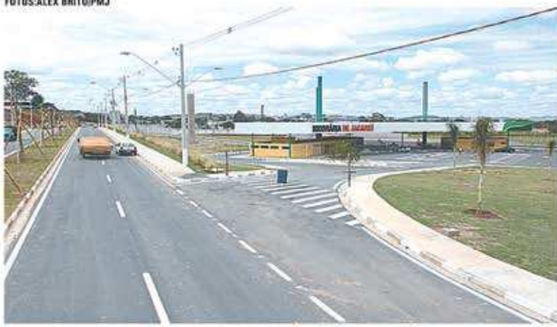
Nova Rodoviária de Jacaréi e trecho novo da avenida Davi Monteiro Lino, no Jardim Marcondes