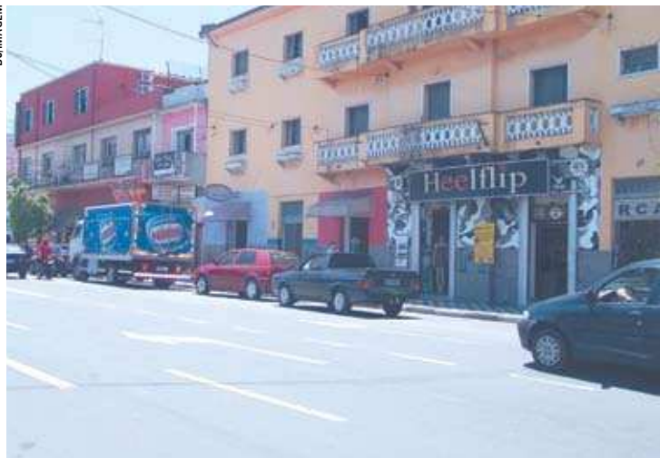
O alvo dos criminosos foi uma loja de moda jovem no início da rua Barão de Jacaré, próximo à Praça Conde de Frontin. Este é o oitavo assalto que o estabelecimento sofre em cerca de sete anos

Este foi o oitavo assalto que o estabelecimento sofreu em cerca de sete anos. Segundo a comerciante, está cada vez mais difícil se dedicar a esse ramo. "Fazia um ano e pouco que eu não era assaltada, porque tem Polícia direta na pra-