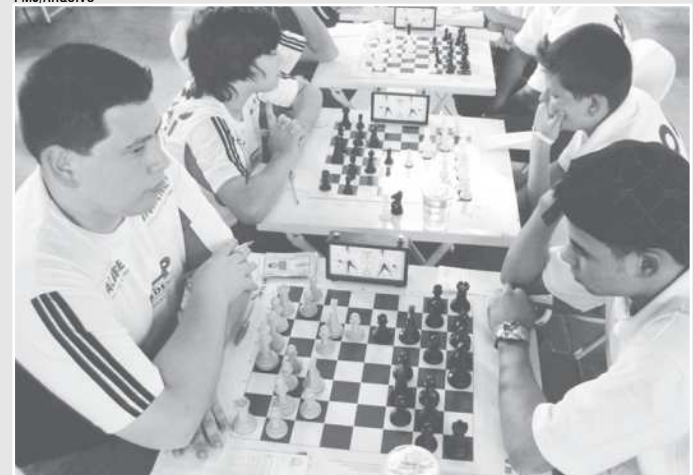
O evento realizado pela Prefeitura de Jacareí e AVPX reunirá competidores de toda a região