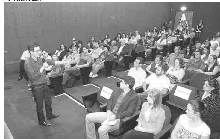
O prefeito Hamilton fala durante evento do 'Descubra Jacaré'