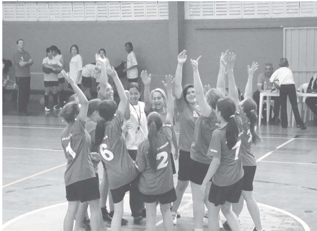
A equipe de basquete feminino do Senai Jacareí vibra com a possibilidade de chegar à final da competição