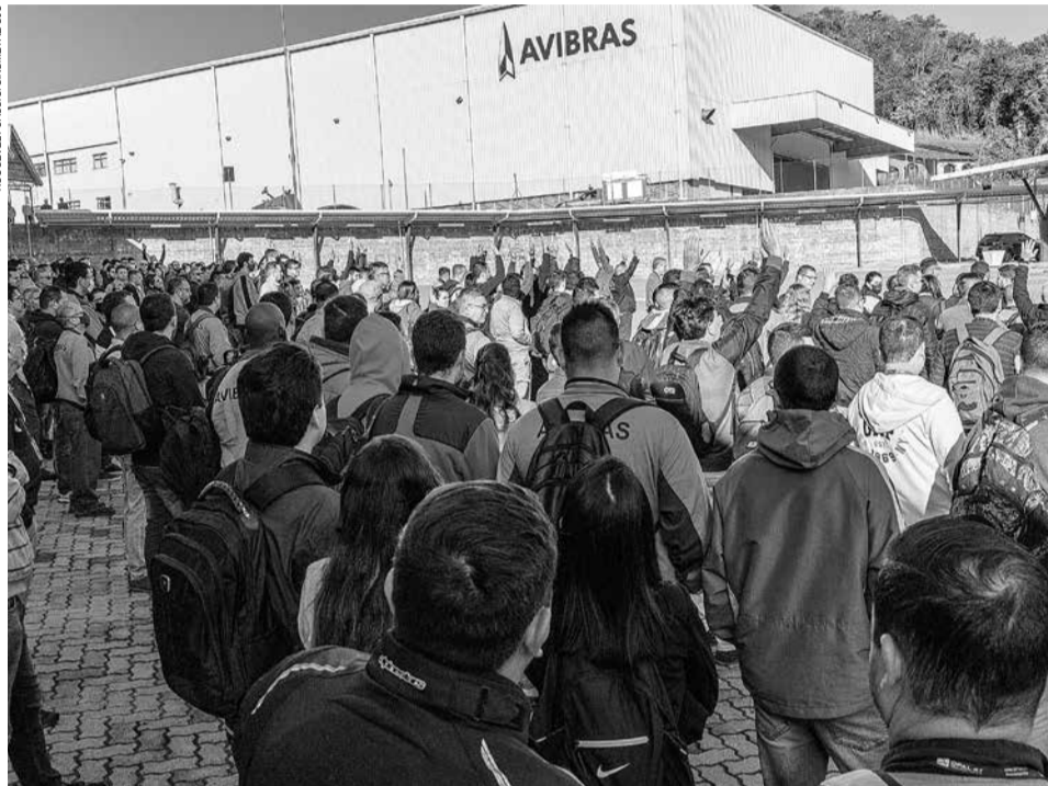
No segundo semestre de 2022, a empresa passou a atrasar os salários. Os trabalhadores entraram em greve em setembro e permanecem de braços cruzados

A empresa, sediada em Jacareí, tem 30 dias para começar a cumprir o plano, a contar da data de homologação pela Justiça