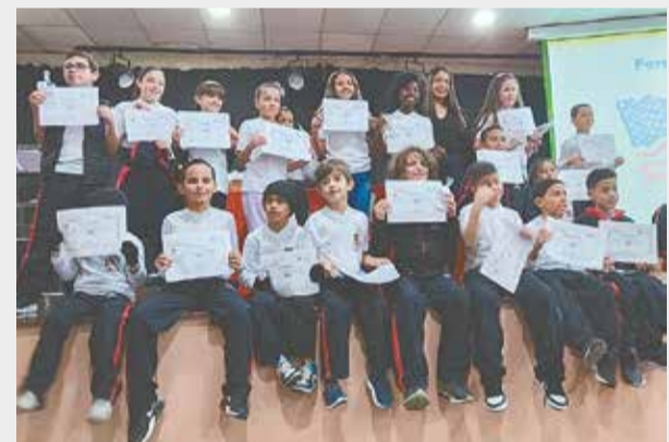
Alunos da rede municipal durante entrega de certificados

O objetivo do curso é apresentar e estimular o aprendizado de uma língua estrangeira aos alunos da rede municipal, contribuindo de forma significativa para o seu aprendizado ao longo da infância, juventude e fase adulta.