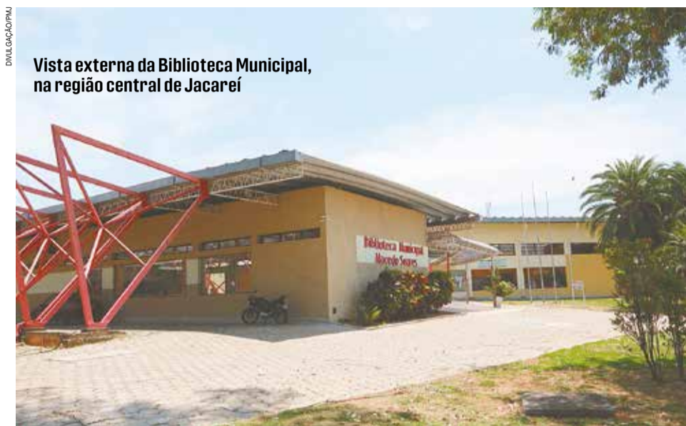
Vista externa da Biblioteca Municipal, na região central de Jacareí

A Biblioteca 'Macedo Soares', sob gestão da Secretaria Municipal de Educação, foi selecionada para o projeto 'Biblioteca Maurício de Sousa 2023', em parceria com o SisEB (Sistema Estadual de Bibliotecas Públicas de São Paulo) e Instituto Maurício de Sousa, com o apoio das