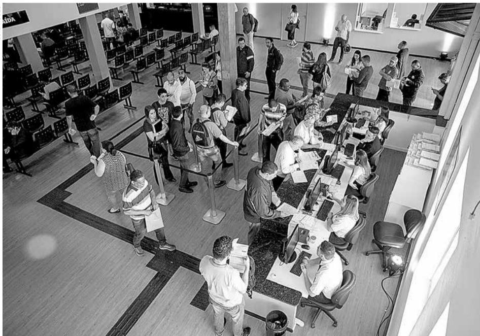
Vista interna da sede da Junta Comercial do Estado de São Paulo, na capital paulista

O Governo de SP afirma que tem empenhado esforços no sentido de desburocratizar, reduzir a carga tributária e 'melhorar o ambiente de negócios', com o objetivo de favorecer a atividade produtiva no estado. Em relação à criação de