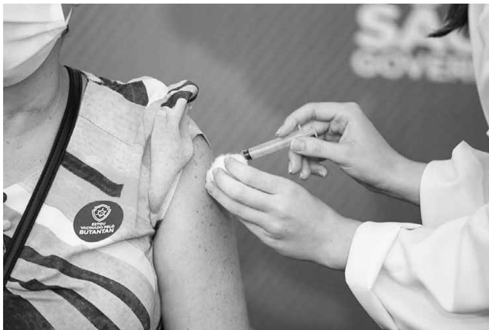
Segundo o governo, mais de 90% da população de São Paulo foi imunizada contra a Covid-19

Não será mais obrigatória a apresentação do comprovante para ter acesso a locais públicos e privados, com exceções específicas