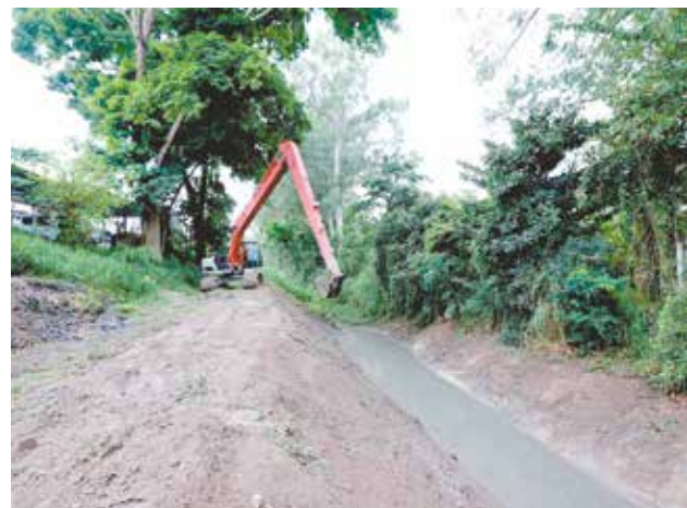
Limpeza removeu resíduos de chuvas, entulho e mato alto

Além do trabalho citado, que se repete nas demais valas e córregos da cidade, fazem parte