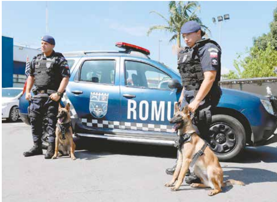
Inicialmente, o GOC de Jacareí vai contar com o auxílio de dois cães policiais

capacitação para operar em atividades de busca e localização, farejamento