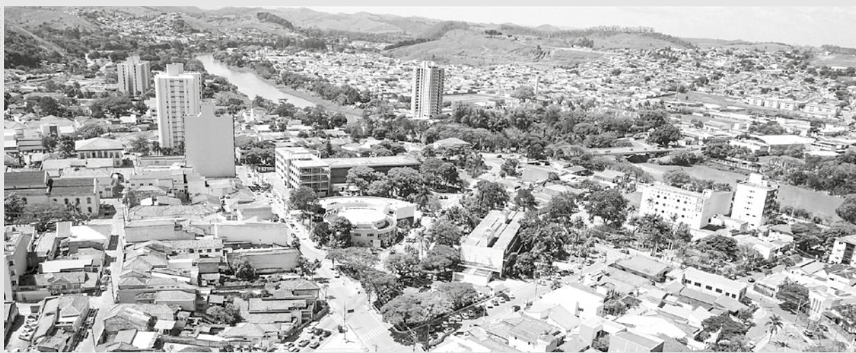
De acordo com a atual administração, cerca de 98,7 mil contribuintes pagarão o carnê do IPTU 2023 em Jacareí

A instalação do 'Bom Prato' no município foi realizada por meio de um convênio entre a Prefeitura de Jacareí e o Governo do Estado. Os recursos para gestão do programa são subsidiados pelo pagamento dos usuários (R$ 0,50 café; R$ 1 almoço), e a diferença é dividida por igual entre governo estadual e Prefeitura. O aluguel do prédio onde fica localizado o restaurante popular é pago pela Prefeitura.