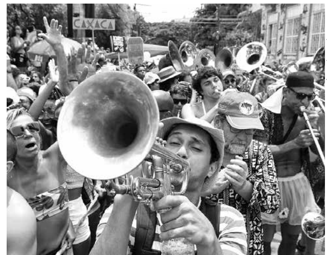
Principal recomendação é para quem está com sintomas respiratório próximo às festas, aos blocos e aos desfiles

O Boletim Infogripe informa ainda que a maioria do país mantém queda ou está em situação compatível com a oscilação natural de casos graves de problemas respiratórios. O cenário de queda é