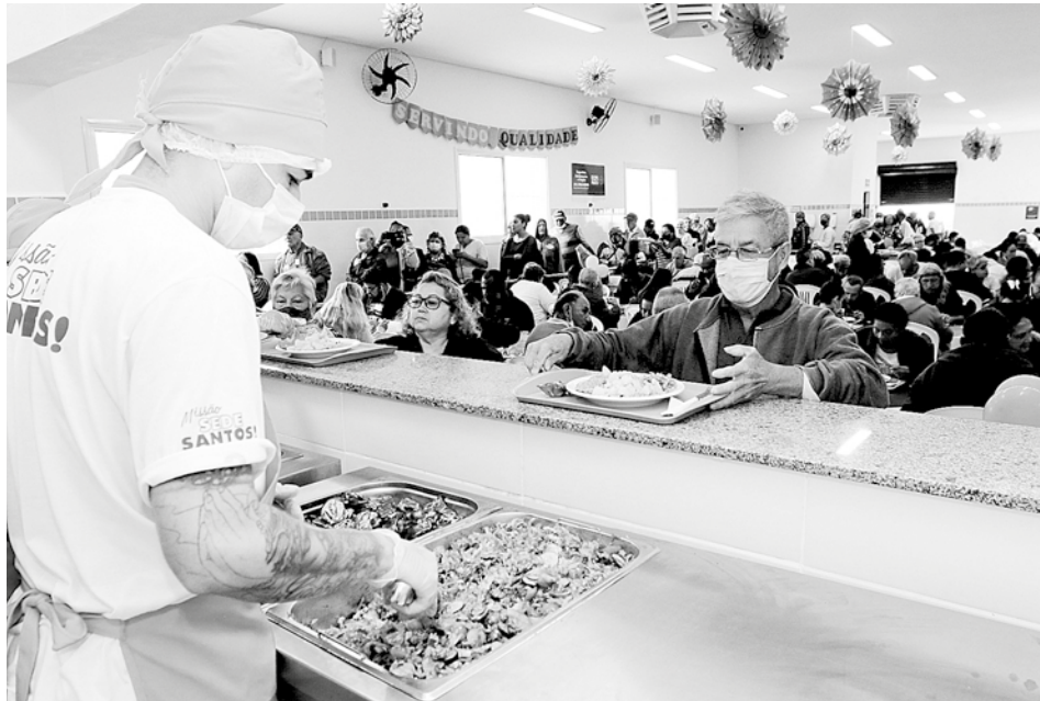
O local é aberto ao público, com atendimento preferencial aos idosos

"O 'Bom Prato' foi inaugurado há seis meses e, desde o início, estamos analisando a demanda de refeições. Com isso, notamos a necessidade de