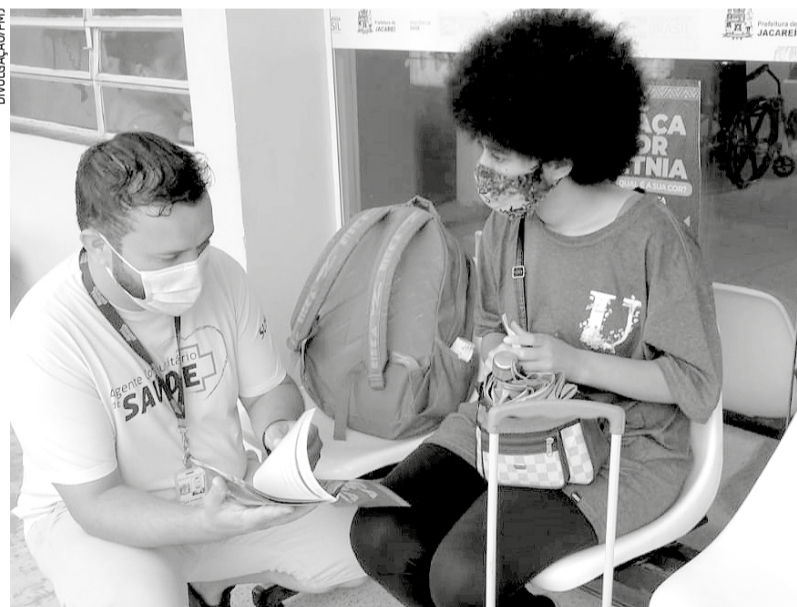
Orientação para paciente que aguardava consulta e demais procedimentos em sala de espera