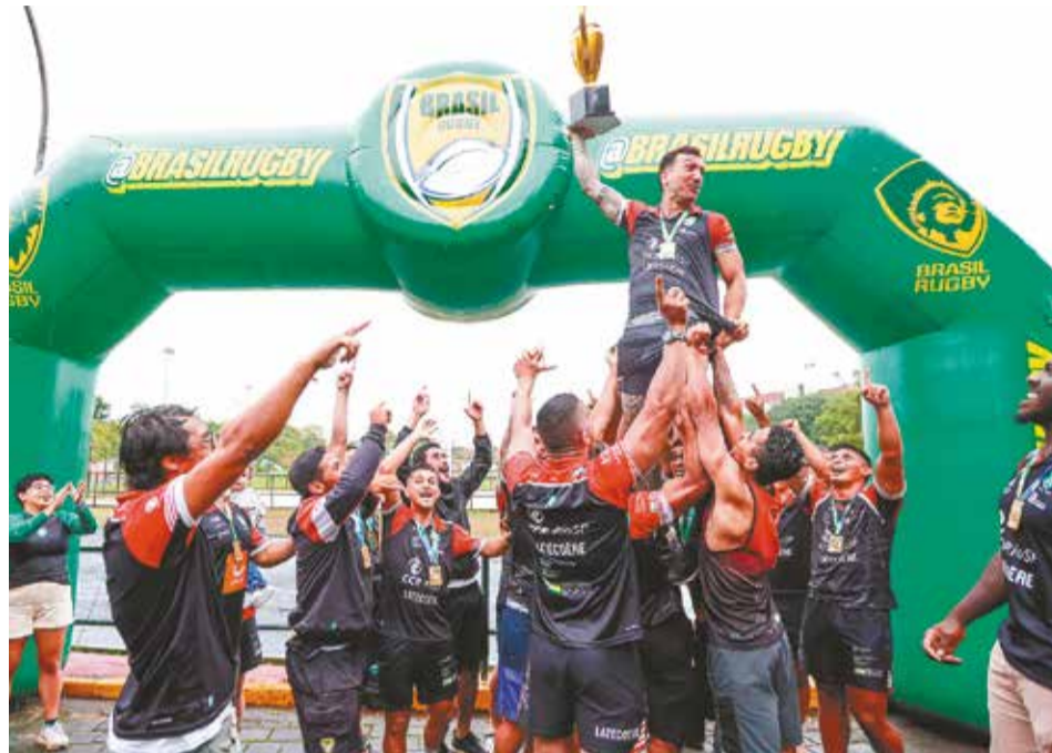
Elenco do Jacaréi Rugby comemora a conquista do Brasileiro de Sevens

No primeiro dia de competição, o Jacaréi, que estava no grupo C, enfrentou Ilhabela e