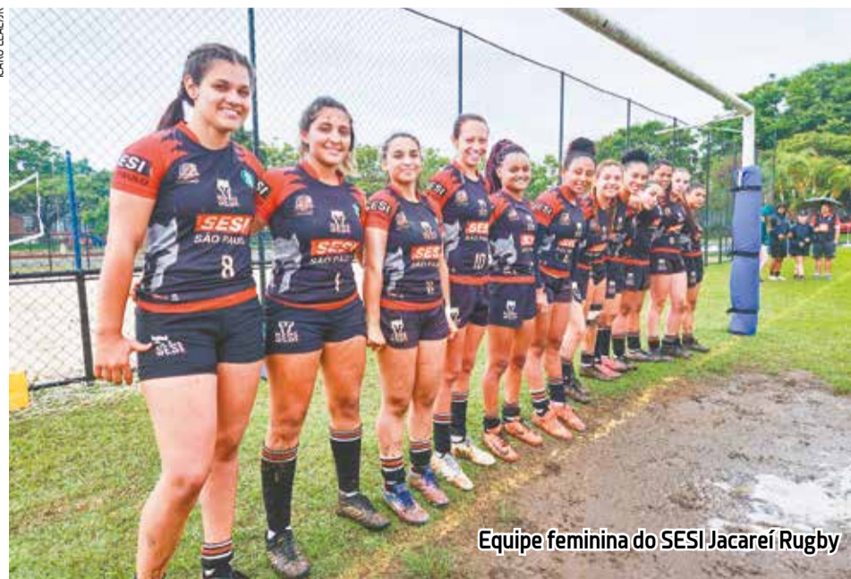
Equipe feminina do SESI Jacaréi Rugby

O terceiro torneio Super Sevens Juvenil do ano contou com a participação de quatro equipes: Jacaréi, Maringá (Maringá-PR), Leões de Paraisópolis (São Paulo-SP) e Melina (Cuiabá-MT). Na primeira fase, todas as equipes jogaram entre si e as duas melhores fizeram