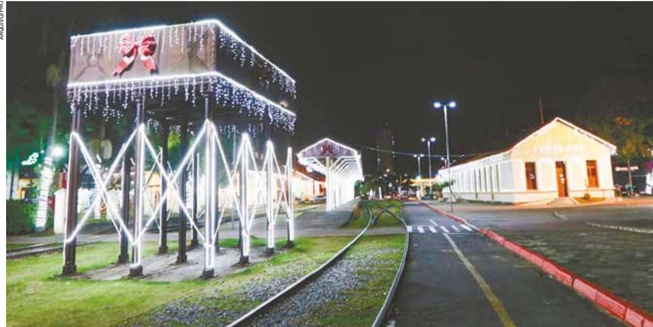
A programação começa com as decorações especiais de Natal, em avenidas, prédios, pontes e pontos turísticos de Jacaréi

A programação oficial já começa com as decorações especiais de Natal, em avenidas, prédios, pontes e pontos turísticos da cidade, que permanecerão iluminados até 6 de janeiro. Já o visitante mais