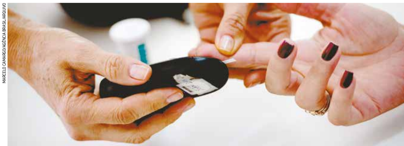
O acompanhamento periódico dos níveis de glicose é recomendado por especialistas a todas as pessoas

Segundo estimativas, 90% dos casos de diabetes no mundo são tipo 2. Apesar de a genética ter uma forte influência no desenvolvimento da doença, o sobrepeso e a obesidade são os principais motivos do crescimento deste tipo