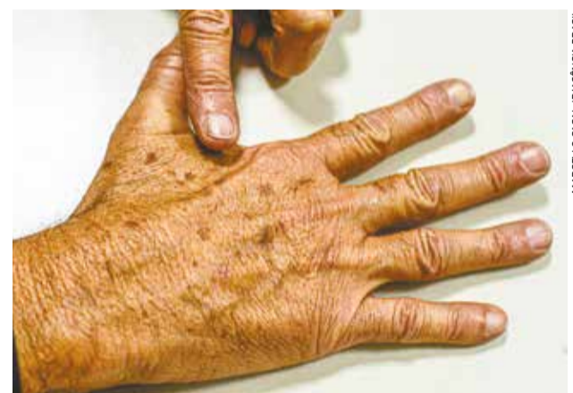
Atendimento regular de um dermatologista pode checar de tempos em tempos se a pele apresenta alguma lesão suspeita

“Está provado que, quanto mais intensidade de sol em fases iniciais da vida, maior o risco no futuro de ter a doença. Não é o sol do verão passado que causa do câncer de pele. É o acúmulo de exposições intensas e queimaduras, aquela vermelhidão, descascar a pele, porque essa