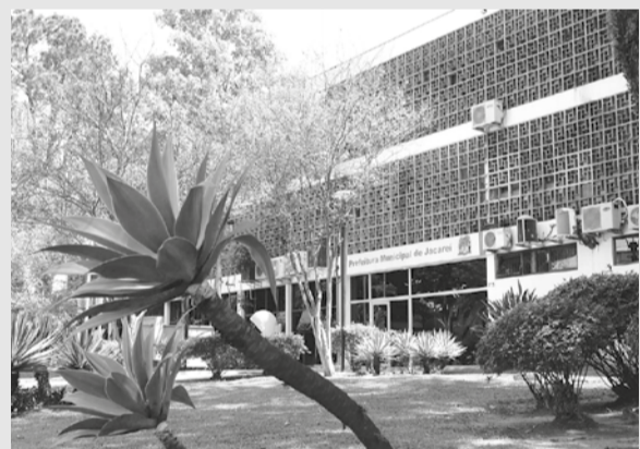
Vista externa da Prefeitura de Jacareí, na região central

realizada pela Subsecretaria de Direitos Humanos, com duas formações sobre a temática 'raça/cor', de modo a sensibilizar os profissionais para o manejo da questão nos territórios.