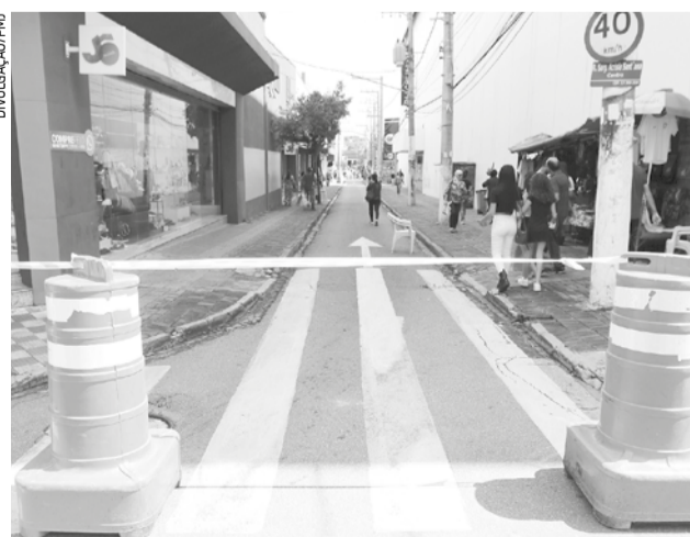
Rua Acrísio Santana está fechada para tráfego de veículos, em horário comercial, desde segunda-feira (28)

A medida faz parte das ações realizadas pela Prefeitura de Jacareí, nessa época do ano,