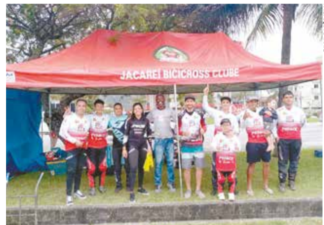
Equipe do Jacareí Bicicross Clube, que encerrou a temporada paulista com o título em duas categorias

atletas. Além dos campeões e vice-campeões, diversos outros atletas de Jacareí conquistaram boas colocações no Campeonato Paulista. Vamos continuar