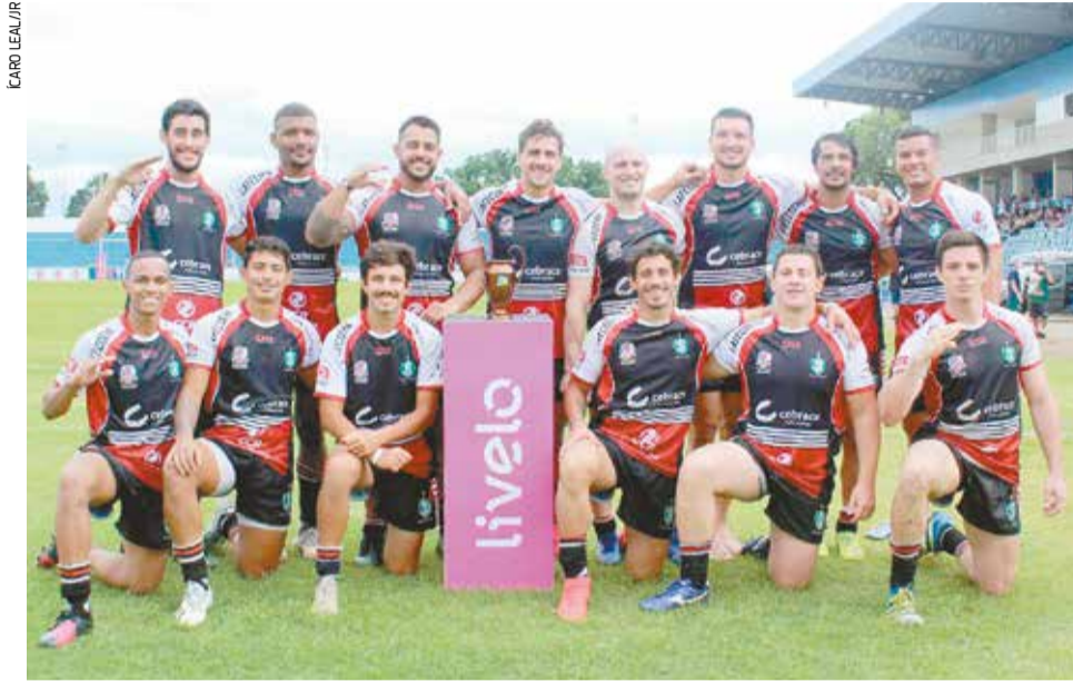
Elenco do Jacareí Rugby que disputará o Brasil Sevens neste fim de semana, em São Paulo

Além do Jacareí Rugby, também estão na disputa do Brasil Sevens os clubes: Pasteur (São Paulo-SP), Poli (São Paulo-SP), Desterro (Florianópolis-SC), São José (São José dos