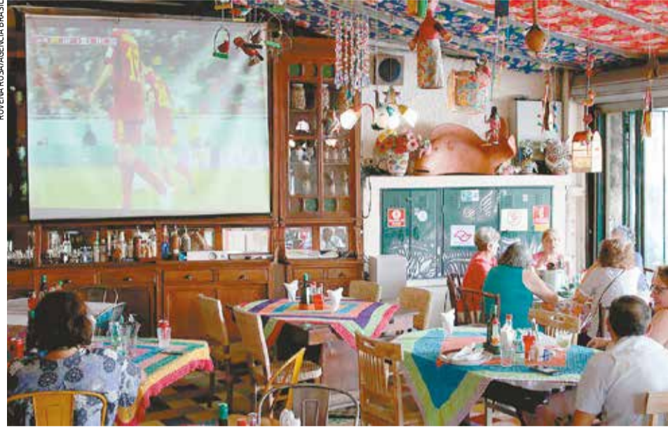
Pesquisa da Abrasel indica que 45% dos restaurantes vão transmitir os jogos