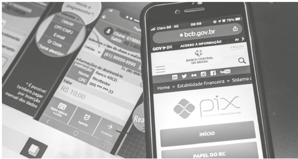
Lançado em fevereiro de 2020, o novo meio de pagamento passou a permitir transações como transferências e pagamentos, incluindo de contas, em até dez segundos

“Nos pagamentos realizados através de cartão