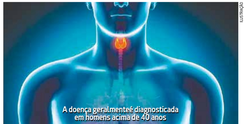
A doença geralmente é diagnosticada em homens acima de 40 anos

sentir falta de ar”, detalha o especialista.