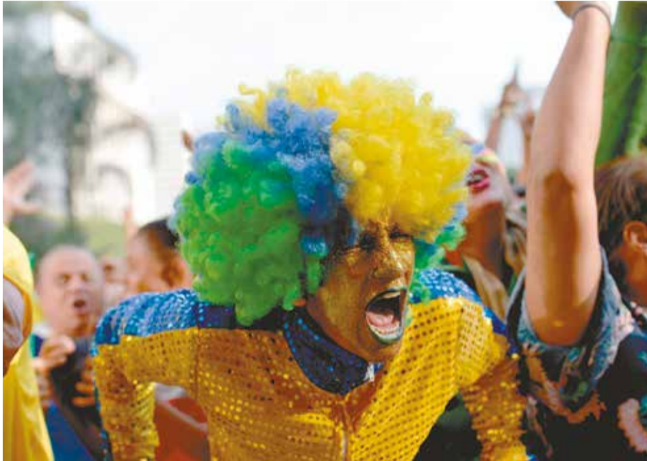
As emoções da disputa causam uma grande descarga de adrenalina no organismo

Para mostrar esse impacto, o Hcor monitorou 30 torcedores, enquanto assistiam às disputas de seus clubes. A análise mostrou que, em momentos de grande emoção, o coração acelerou. “Quando um gol foi marcado, por exemplo, registramos quase 140 batimentos por minuto (bpm), um aumento de 75%, se comparado à média de um adulto em repouso, que é em torno de 80”, explica o Dr. César Jardim, cardiologista