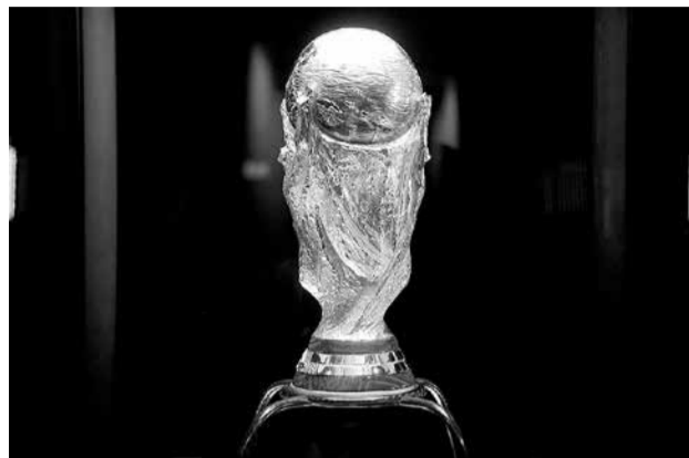
A cobiçada Taça FIFA foi disputada no Brasil, em 2014

Ainda em 1928, na Holanda de Hirschman, foi decidido que haveria um Mundial de futebol. Em Zurique, a decisão foi ratificada, e no ano seguinte, em Barcelona, o Uruguai foi indicado como primeira sede, superando as candidaturas de Hungria, Itália, Holanda, Espanha e Suécia. Nesse primeiro Mundial, 13 seleções tomaram parte: Bélgica, Romênia, Iugoslávia, França, Estados Unidos, México,