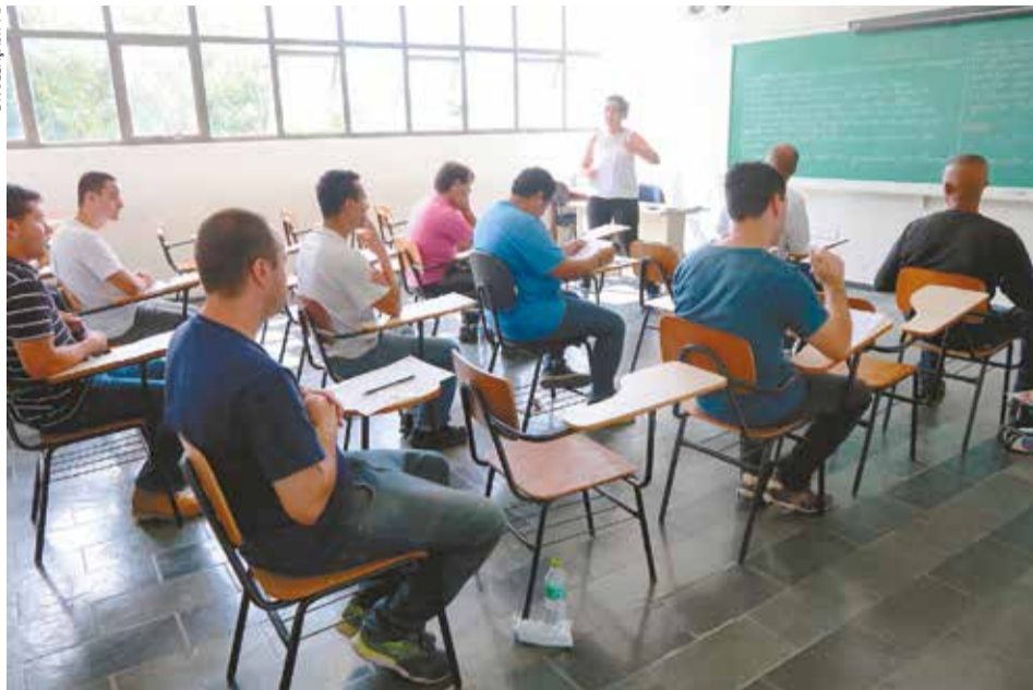
Além das vagas de fiscal de posturas, o concurso oferece mais 37 em áreas técnicas e da saúde

As 40 vagas ofertadas no concurso público, de níveis Médio e Superior são: Analista de Recursos Humanos (3); Analista de Sistemas (1); Analista de Suporte de Rede (1); Arquiteto (4); Contador