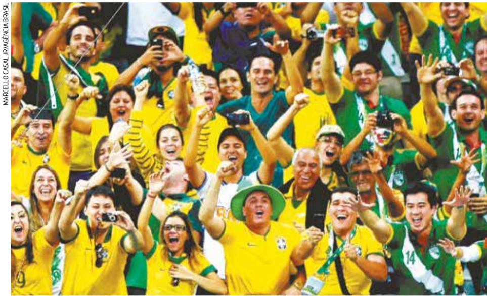
Jogos de futebol são cheios de emoções extremas e exigem mais do coração

Em 2006, ano em que a Alemanha foi campeã em sua casa, um grupo de pesquisadores da revista americana, estabeleceu que iria comparar o número de emergências cardíacas em hospitais da cidade de Munique durante os jogos, com os dados que se tinha antes do torneio. O resultado obtido foi que, de fato, a incidência de casos de emergências cardíacas nos hospitais era quase três vezes maior, sendo os