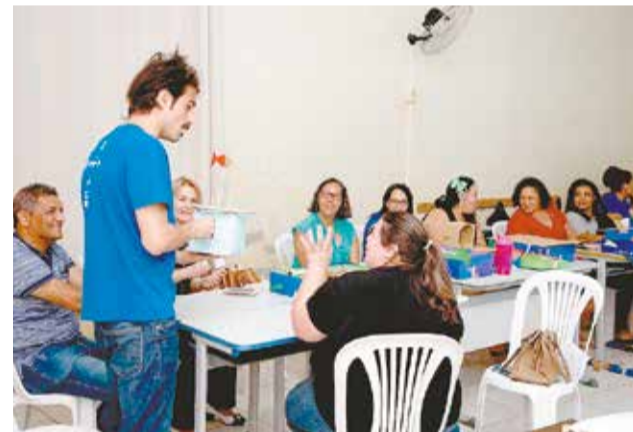
Até dezembro, cerca de 40 educadores serão capacitados para aplicar as atividades do programa em sala de aula

“O ArteLab agrega novas tecnologias de aprendizagem que apoiam o desenvolvimento integral do aluno, com atividades em que as crianças de fato colocam a ‘mão na massa’. Além disso elas são estimuladas a descobrir e aprender enquanto constroem seus projetos experimentais com a ajuda das T-Box, que são os kits distribuídos às escolas com itens como baterias,