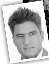
Capa da obra do jornalista esportivo Ariel Senosiain (no detalhe)