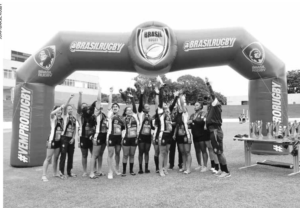
Time feminino que não conseguiu o acesso para a 1ª divisão do Super Sevens em 2023

O Jacareí Rugby, que acabou na segunda posição geral, acumulou 10 vitórias em 15 jogos realizados ao longo das três etapas, uma a menos do que o Pasteur. Em Curitiba (PR), quando foi campeão daquela etapa, o clube conseguiu quatro vitórias. Em São Paulo (SP), quando encerrou com o vice, o time feminino