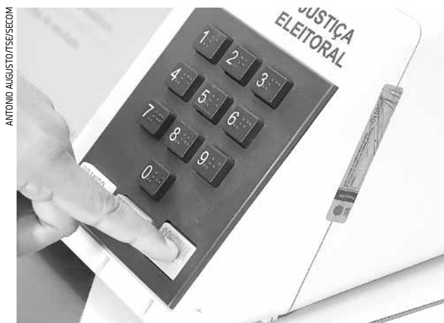
Mais de 140,4 mil eleitores foram às urnas em Jacareí

Do total de 176.834 eleitores inscritos no município, 140,4 mil foram às urnas neste segundo turno, sendo registrados 11.022 votos válidos a mais para presidente e 4.371 para governador em relação ao primeiro turno. Os números fazem parte de um levantamento realizado pelo Diário de Jacareí após a divulgação dos resultados oficiais.