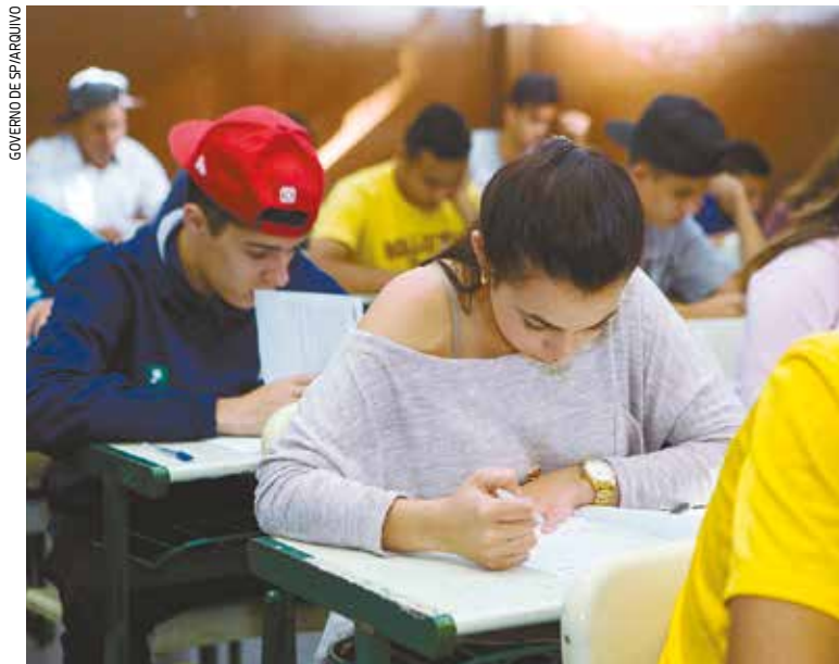
Os componentes avaliados nos dois dias de SARESP são Língua Portuguesa, Matemática e área de Ciências da Natureza

Principal avaliação da rede estadual, tem a finalidade de diagnosticar o aprendizado do estudante e compõem o resultado do IDESP