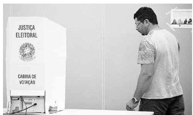
Para ficar quite com a Justiça Eleitoral é preciso ter votado em todas as eleições passadas ou justificado as ausências

Existem três formas de justificar a ausência