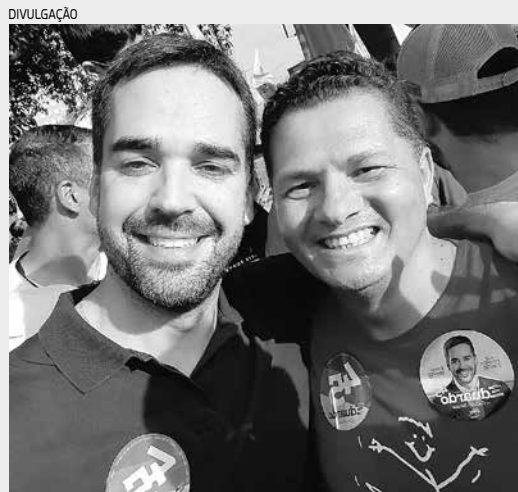
Izaias encontrou-se com Eduardo Leite, com quem conversou e tirou uma 'selfie'

Grosso do Sul (estados onde o partido elegeu governadores) não surja um PSDB que dê exemplo do Brasil e a São Paulo", afirmou. E, completou: "quem sabe em 2026 sejamos dignos da escolha pelo povo e de competir pra valer".