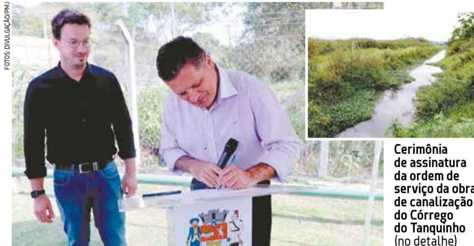
Cerimônia de assinatura da ordem de serviço da obra de canalização do Córrego do Tanquinho (no detalhe)

O prazo estimado para execução da obra, pela empresa vencedora da licitação, a Compec Galasso Engenharia e Construções Ltda., é de 18 meses, em um investimento de R$ R$