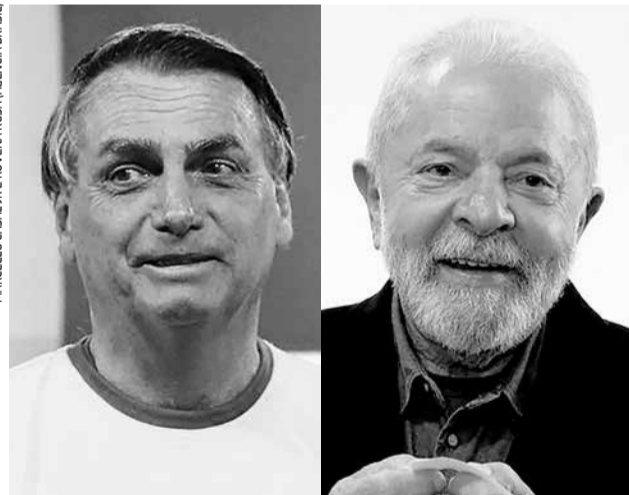
Em Jacaré, no primeiro turno, para presidente, Bolsonaro (PL) recebeu 71.611 votos (54,23%) e Lula (PT) teve 44.402 votos (33,63%)