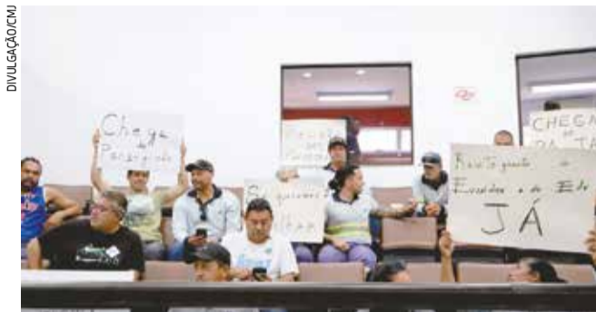
Funcionários do SAAE protestam contra a demissão do colega, durante sessão de Câmara, na quarta-feira (26)

O Diário de Jacareí procurou o SAAE para comentar o assunto. Inicialmente, em nota, a autarquia informa que foram ouvidos 17 servidores, além da análise das demais provas documentais