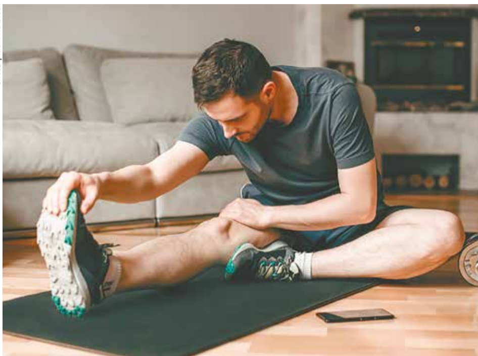
A prática de exercícios físicos pode proteger os rins dos danos provocados pelo diabetes