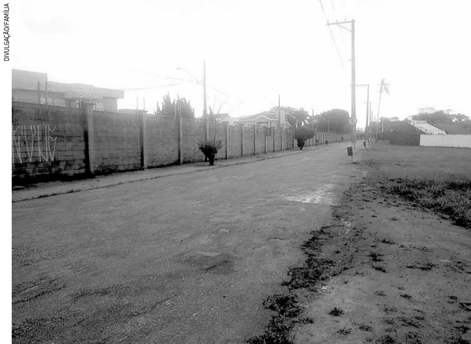
Rua que dá acesso ao estádio do JAC, na região leste da cidade, onde ocorreu o estupro

De acordo com informações da mãe da vítima, que registrou um Boletim de Ocorrência na Delegacia de Defesa da Mulher (DDM), a família ficou sabendo do fato quando a jovem chegou em casa visivelmente abalada. Inicialmente, a vítima relatou à mãe que, por volta das 21h, quando voltava para a casa após descer do ônibus circular, teria sido abordada na Rodovia