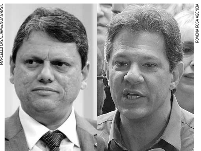
Em Jacaré, no primeiro turno, para governador, Tarcísio (Republicanos) recebeu 59.933 votos (49,30%) e Haddad (PT) teve 35.248 votos (29,00%)

O atual governador, Rodrigo Garcia (PSDB) ficou em terceiro lugar, com 22.334 votos em Jacaré (18,37%). Tarcísio e Haddad disputarão o segundo turno em São Paulo.