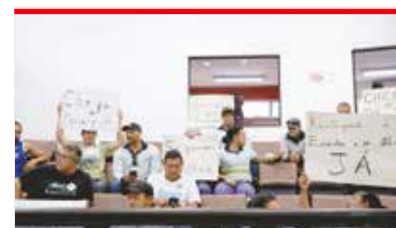
Funcionários do SAAE protestam contra a demissão do colega

Versão impressa: circulando somente aos sábados / acesse nossa versão online e acompanhe as notícias em tempo real