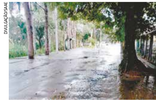
Avenida Major Acácio pouco depois do rompimento de uma adutora do SAAE, na manhã do dia 29 de março deste ano

entre vereadores e funcionários do SAAE. Eles reivindicam a intervenção dos parlamentares junto