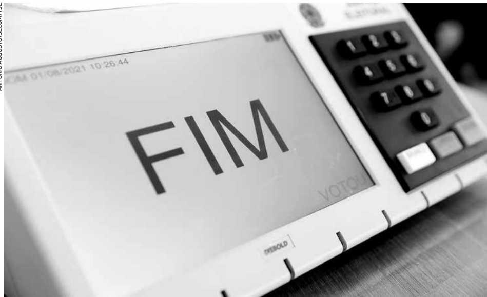
Jacaré tem duas zonas eleitorais (396 e 62), com um total de 546 seções (urnas eletrônicas)

Eleitores entre 25 e 34 anos representam a terceira maior faixa do eleitorado com direito a voto na cidade. Do total de 32.771