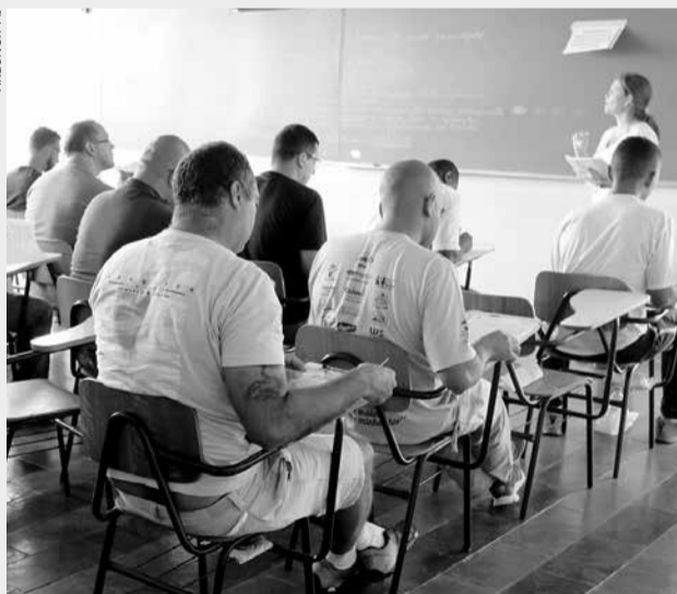
Candidatos em sala de aula durante concurso público promovido pela Prefeitura de Jacareí

(1); Enfermeiro (2); Engenheiro Civil (4); Engenheiro Elétrico (1); Fiscal de obras (3); Fiscal de Posturas (4); Fonoaudiólogo (2); Jornalista 25h (2); Médico Veterinário (1); Técnico de Enfermagem (4); Técnico de Segurança (1); Técnico de Laboratório (4); Topógrafo (1).