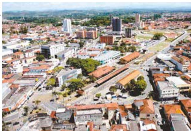
Vista geral da região central da cidade de Jacareí

Já a Conferência da Cidade, em 26 de novembro, será dedicada à votação das propostas que, efetivamente, irão integrar o projeto de lei final, a ser enviado à Câmara Municipal.