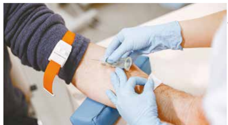
Exame de sangue: conhecido, popular e fácil de ser realizado

“Você alivia o problema através da consciência [com os tratamentos tradicionais], mas não o resolve se já há cicatrizes resultantes das disfunções traçadas