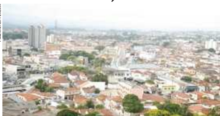
Os carnês devem ser enviados até a segunda quinzena de fevereiro

Entre os dias 15 e 18 de março vence o prazo para o pagamento da primeira parcela ou da parcela única, à vista, do IPTU e da taxa de coleta de resíduos sólidos (taxa do lixo).