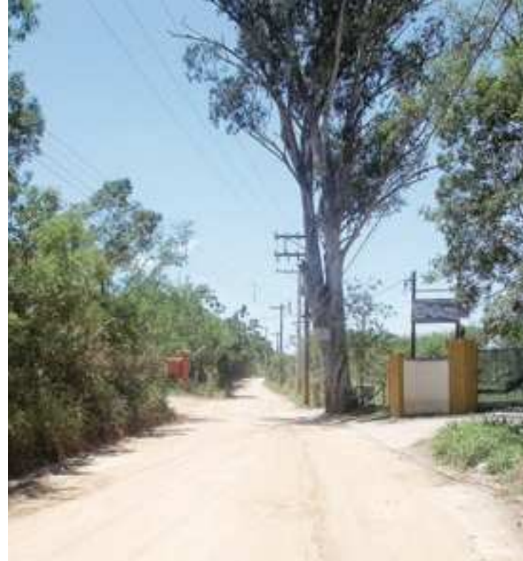
Localizado no Jardim Colônia, região sul, o Agrocentro está situado às margens da rodovia Nilo Máximo