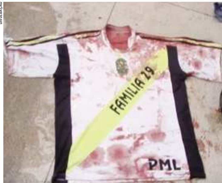
Uma das vítimas, um funileiro, de 26 anos, seria o alvo dos assassinos e levou quatro tiros. Na foto, a camisa que ele vestia e que pertencia a um time de futebol do bairro, do qual 'Goiabinha' também fazia parte

HISTÓRICO – Somente este mês, pelo menos, quatro pessoas foram assassinadas nos arredores do Parque Meia-Lua, região norte. Além do funileiro e do ajudante, o operador de máquinas, de 27 anos, conhecido pelo apelido de 'Goiabinha', foi