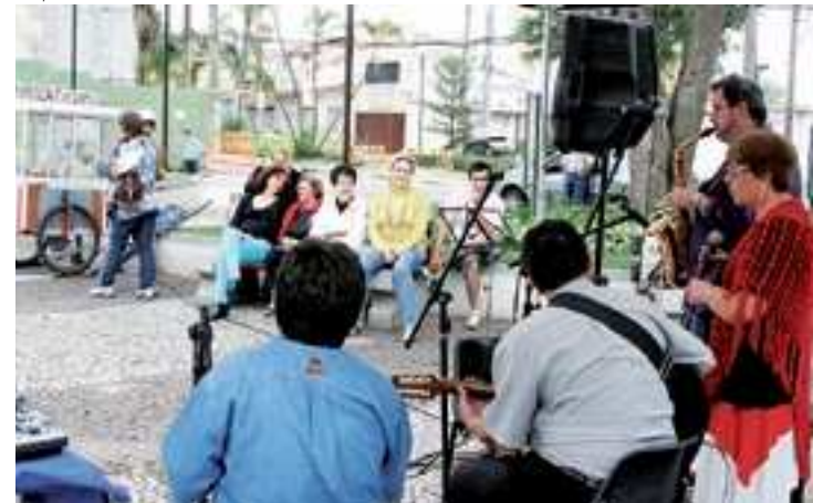
Para animar o final do ano, as apresentações serão realizadas pelo grupo 'Choro da Terra'