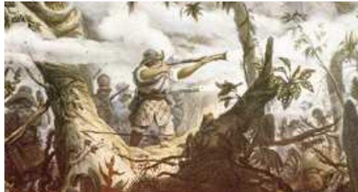
Ilustração de Jean Baptiste Debret mostra soldados e índios de Mogi das Cruzes, em 1834