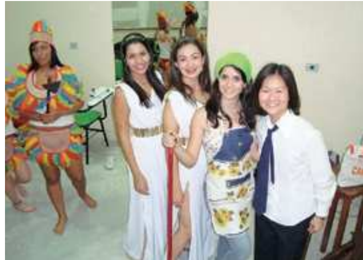
Alunas do 1º ano do Ensino Médio se preparam para entrar no palco

ressalta que a participação dos alunos proporciona a fixação mais eficaz do conhecimento, já que todos se envolveram tanto na criação do roteiro da peça, como figurino, iluminação e apresentação. "É uma aprendizagem mais prazerosa, porque eles transportam, para a linguagem deles, a linguagem dos livros que,