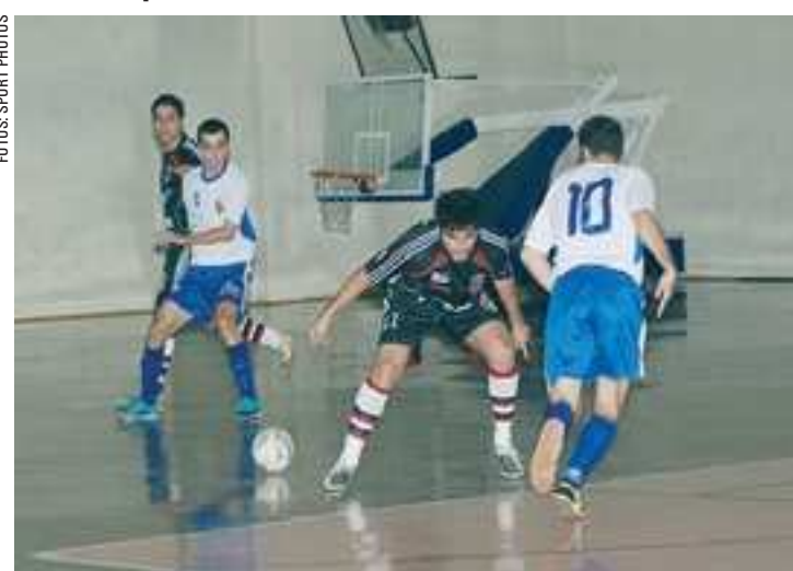
Jacareí chegou a abrir três gols de vantagem no primeiro tempo, mas foi surpreendido pelo forte time do Pinhalense

Após a conquista do Metropolitano, o time retorna às quadras na próxima quinta-feira (24) visando os Jogos Regionais que acontecem em julho, na cidade de Taubaté (SP).