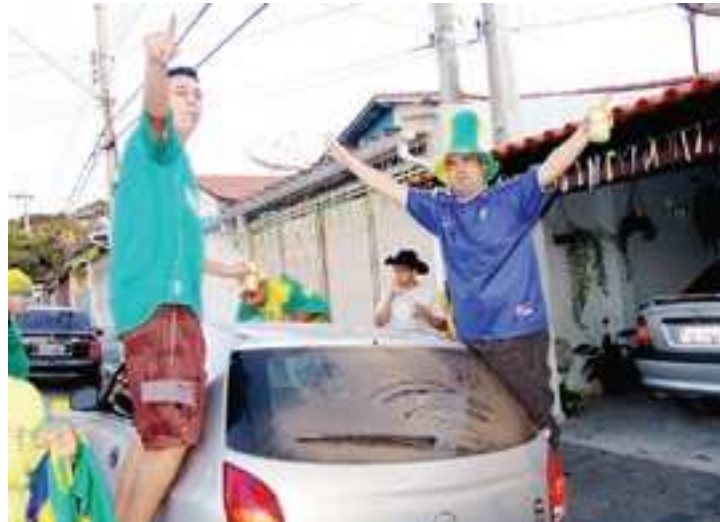
Após o jogo, torcedores saíram às ruas do bairro para comemorar