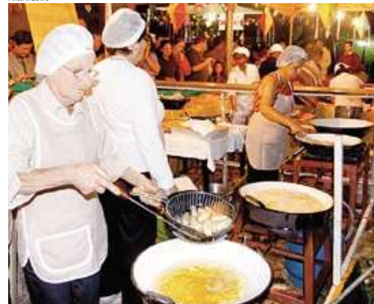
As barracas estão a cargo de entidades assistenciais da cidade que venderão três unidades do bolinho a R$ 1,00