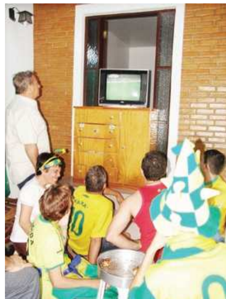
Em uma das residências, o aparelho de TV na garagem garantiu as melhores imagens da vitória do Brasil sobre a Costa do Marfim

A Seleção Brasileira volta a jogar na sexta-feira (25), às 11h, contra a Seleção de Portugal, que vem embalada depois da goleada de 7 a 0 em cima da Coreia do Norte, na manhã de segunda-feira (21).