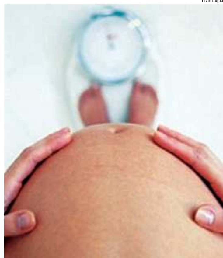
Estudos mostram que os bebês de mulheres que engravidaram obesas correm mais risco de sofrer malformações