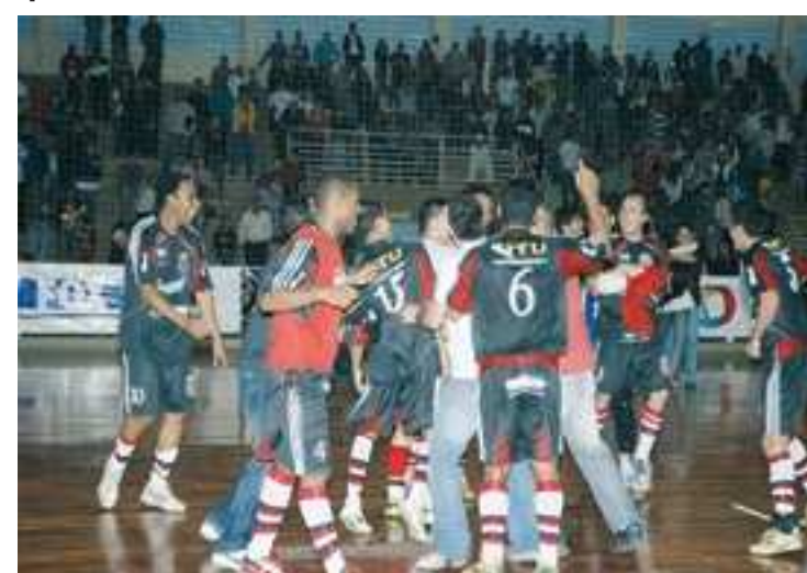
Fim de jogo: equipe jacareense celebra mais um título do Campeonato Metropolitano, após campanha sem nenhuma derrota