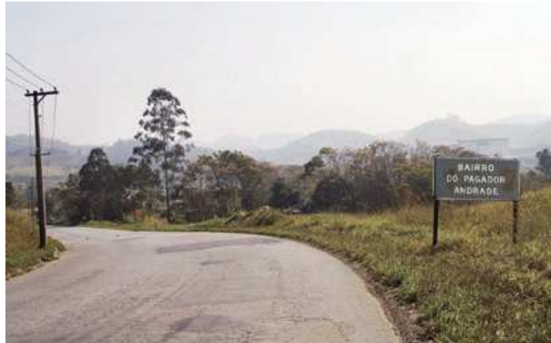
O corpo foi encontrado em uma estrada, no bairro Pagador Andrade, região oeste. Segundo a Polícia, o crime foi cometido no mesmo dia do encontro do cadáver, no domingo (20)