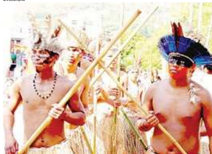
A tribo fará uma apresentação de dança circular para as crianças jacareenses, como parte das atividades do projeto 'Todo dia é dia de índio'