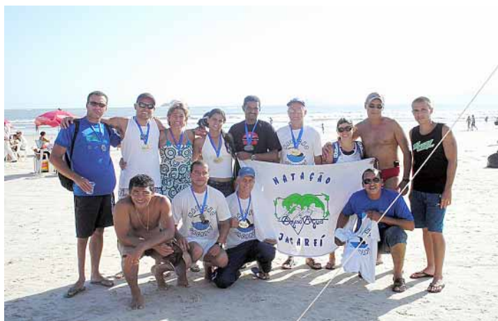
Jacareí foi representada por 13 atletas que integram a Associação Master de Nataçao