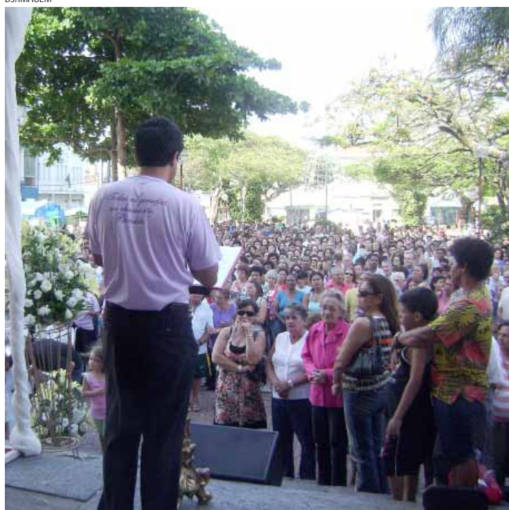
Fiéis se aglomeraram em frente à Igreja Matriz para assistir à missa

dades, a festa da 'Imaculada Conceição' tem o objetivo de evangelizar e homenagear a padroeira da cidade.