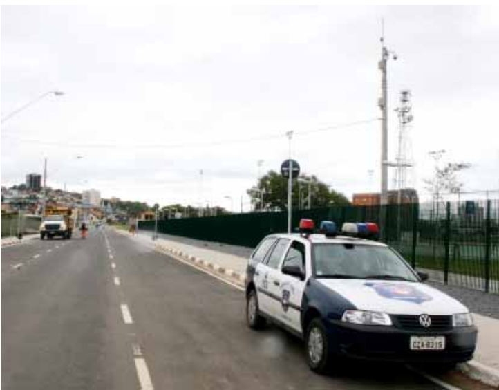
A nova avenida do Centro vai ganhar o nome de Davi Monteiro Lino