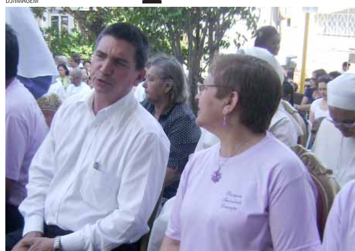
O prefeito, Marco Aurélio de Souza, participou da celebração de ontem