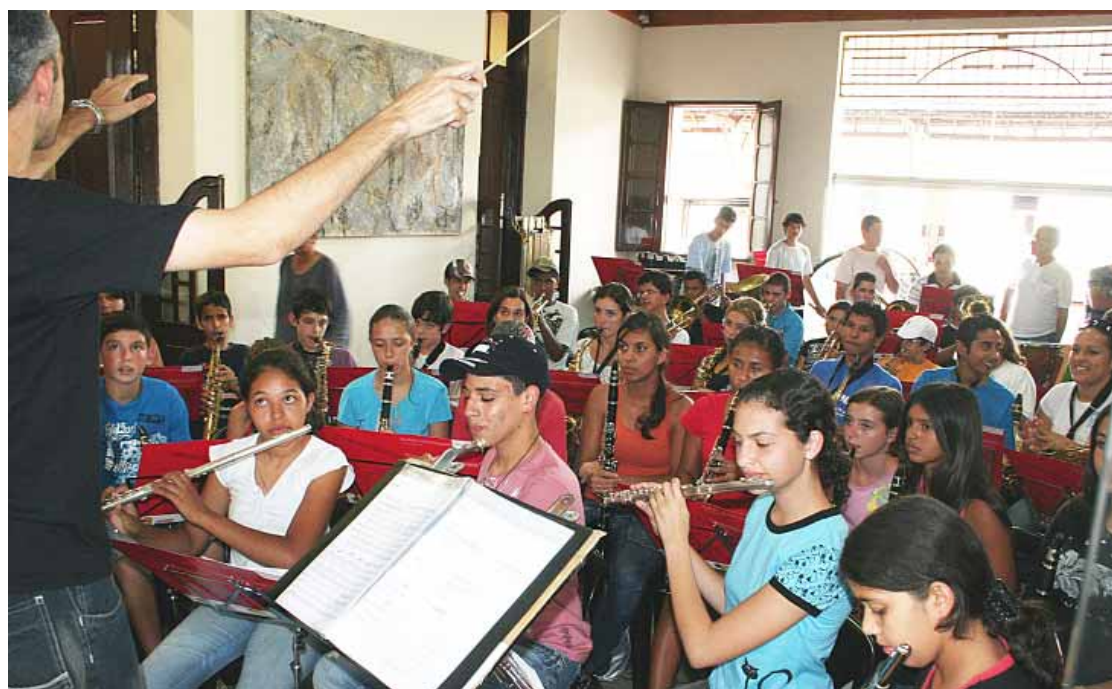
Integrantes da Orquestra Sinfônica Jovem, durante ensaio realizado no Pátio dos Trilhos