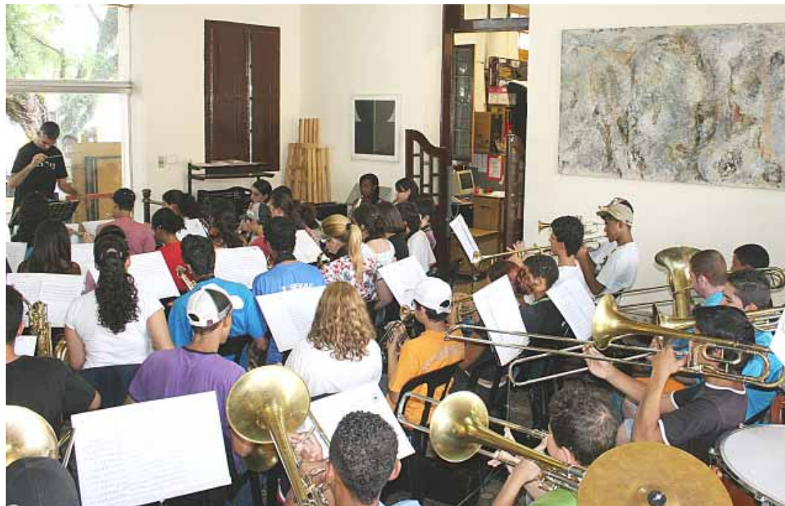
Integrantes da Orquestra Sinfônica Jovem, durante ensaio realizado no Pátio dos Trilhos