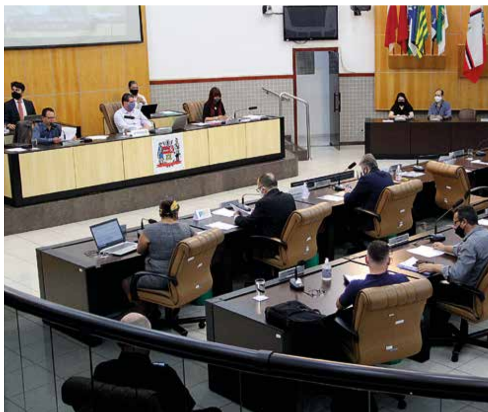
Vista geral do Plenário da Câmara Municipal de Jacareí (atual Legislatura)