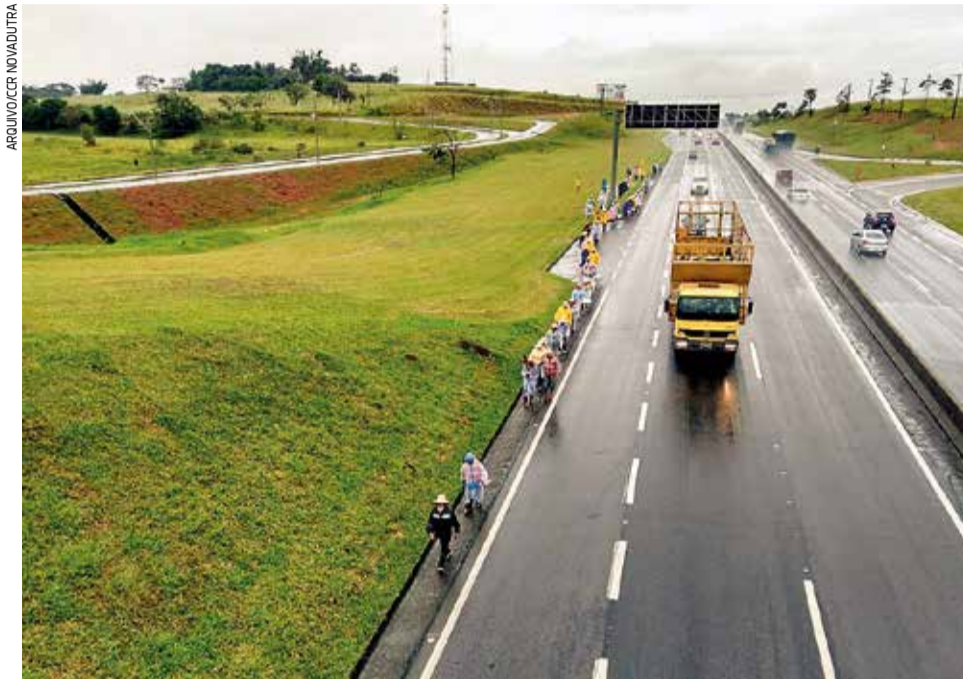
A cada ano a concessionária contabiliza o aumento no número de romeiros caminhando pelos acostamentos da Rodovia Presidente Dutra em direção à Basílica de Aparecida

A CCR NovaDutra iniciou sua campanha de segurança e orientação a peregrinos e motoristas que trafegam pela via Dutra sobre a época de romarias a pé pelo acostamento da rodovia. A campanha, realizada todos os anos, reforça sobre os riscos de romarias a pé pelo acostamento e orienta sobre a utilização de um caminho mais seguro planejado para esta manifestação de fé: a Rota da Luz SP.