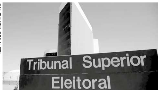
Vista externa do prédio da Justiça Eleitoral, em Brasília

O número exato de candidatos que vão disputar vagas de prefeito, vice-prefeito e vereador ainda nem foi fechado pela Justiça Eleitoral, mas já é o maior desde 2000, quando a votação no país foi 100% eletrônica pela primeira vez. Até as 15h de sexta-feira (2), o portal lançado pelo Tribunal Superior Eleitoral (TSE) com essas informações, já registrava 550.606 solicitações. O recorde anterior havia sido em 2016, com