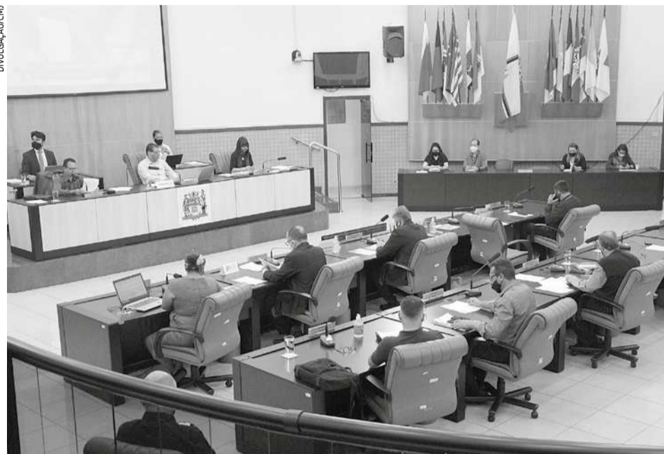
Vista geral do Plenário da Câmara Municipal de Jacareí (atual Legislatura)

Desse total, 114 são do sexo feminino, sendo que Partido dos Trabalhadores (PT) é o partido com maior representatividade feminina no pleito. Nove entre seus 20 concorrentes