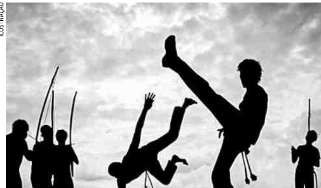
A capoeira ou capoeiragem mistura arte marcial, esporte, cultura popular, dança e música, entre outros

As inscrições serão realizadas de 29 de junho a 17 de julho, através de plataforma divulgada no site da Fundação, www.fundacaocultural.com.br . As inscrições também poderão ser