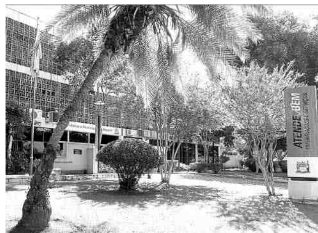
Vista externa do prédio da Prefeitura Municipal de Jacareí

Em relação a alíquota de contribuição dos