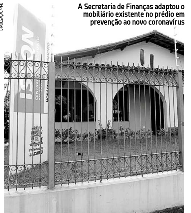
A Secretaria de Finanças adaptou o mobiliário existente no prédio em prevenção ao novo coronavírus