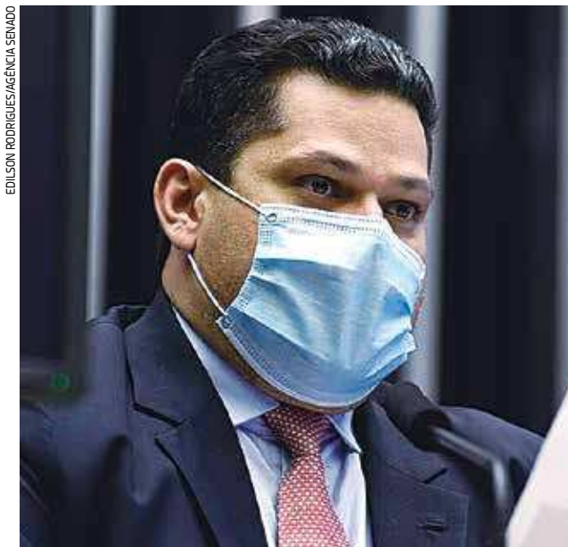
O presidente do Congresso, Davi Alcolumbre (DEM-AP), destacou que prevaleceu o entendimento no Congresso

Ao participar presencialmente da sessão o presidente do Tribunal