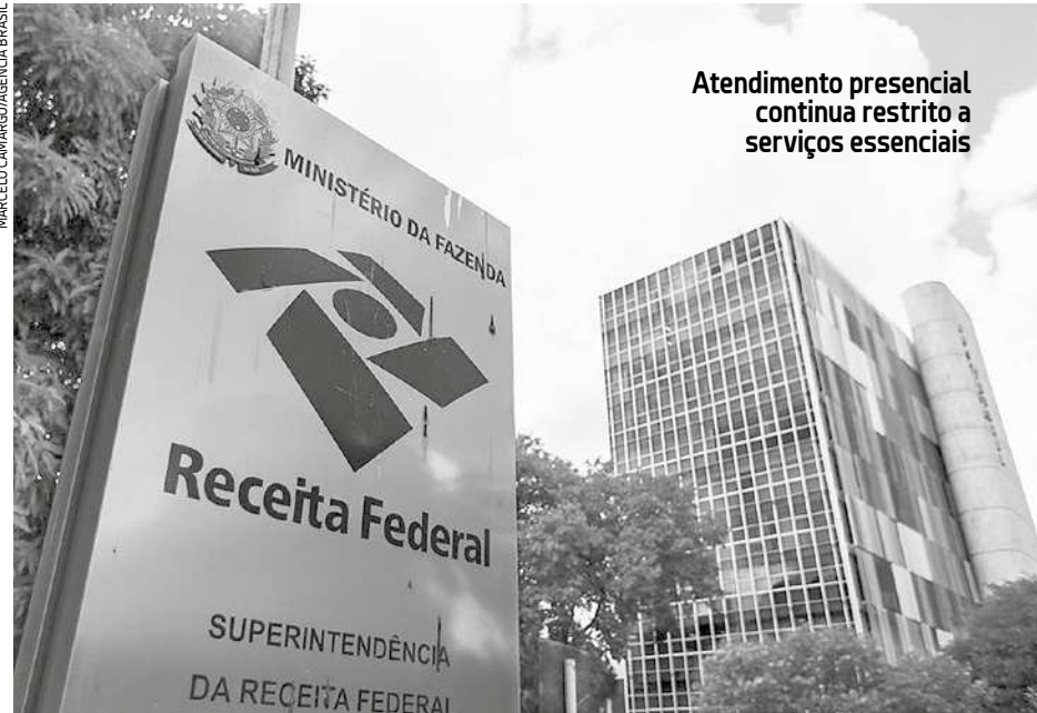
Atendimento presencial continua restrito a serviços essenciais

Segundo a Receita, os procedimentos administrativos que permanecem suspensos até o dia 31 de julho são: emissão eletrônica automatizada de aviso de cobrança e intimação para pagamento de tributos; procedimento de exclusão de contribuinte de parcelamento por inadimplência de parcelas; registro de pendência de regularização no Cadastro de Pessoas Físicas motivado por ausência de declaração; registro de inaptidão