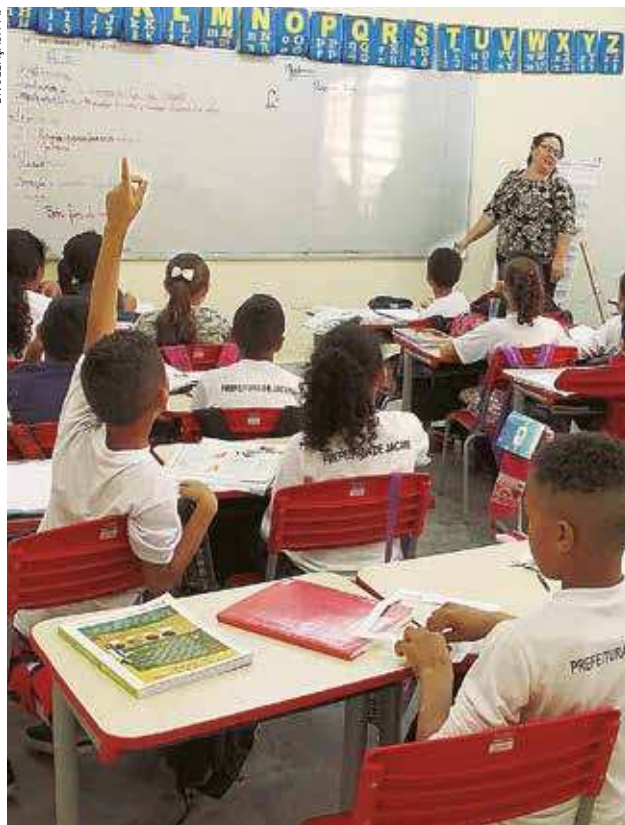
Jacaréi deverá seguir as orientações da Secretaria Estadual de Educação sobre o rodízio dos alunos

protocolos de nove países, além de todos os materiais da Undime Nacional, Consed, e todos os parceiros do Arranjo de Desenvolvimento da Educação, na parceria Suzano de Educação, num total de sete municípios. Prevendo as adequações necessárias, “o estudo está sendo construído coletivamente com as equipes gestoras, professores e, na sequência, os pais – para validação da proposta pela Vigilância”, informa em nota.