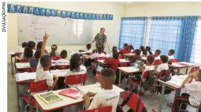
Jacareí deverá seguir as orientações da Secretaria Estadual de Educação sobre o rodízio dos alunos

divulgado pela Secretaria de Educação de São Paulo, desde que validado pela área de saúde, a previsão de retorno é para o dia 8 de setembro. PÁG. 4