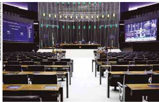
Câmara aprova adiamento das eleições municipais, que passam de 04 de outubro para 15 de novembro (primeiro turno)

O texto aprovado permite ainda a realização, no segundo semestre deste ano, de propagandas institucionais relacionadas ao enfrentamento da pandemia de coronavírus, resguardada a possibilidade de apuração de eventual conduta abusiva, nos termos da legislação eleitoral.