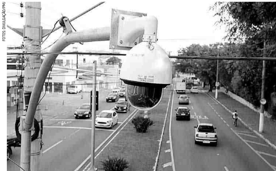
Câmera do COI na Avenida Nove de Julho, em frente à ETEC, na região central

A implantação do COI é uma das promessas de campanha do prefeito Izaias Santana (PSDB). O processo formal de implantação do sistema vinha se arrastando desde abril de 2018. Em julho do mesmo ano foi aberta a licitação. Mas, de acordo com a atual administração, devido a recursos movidos por empresas consideradas inabilitadas “houve demora