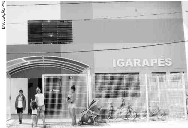
Vista externa da EMEF Prof. Aristeu José Turci, no Igarapés