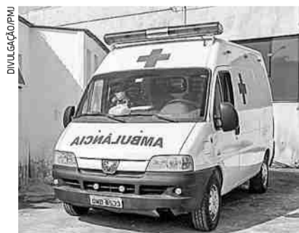
Ambulância da antiga Distal que será utilizada durante a pandemia

A decisão foi proferida pela juíza Rosângela de Cássia Pires Monteiro, titular da Vara da Fazenda Pública de Jacareí. Em seu despacho, na sexta-feira (26), a magistrada autoriza a circulação dos veículos ‘sem que sofram consequências de eventual ato de apreensão pela inadimplência de licenciamento dos veículos