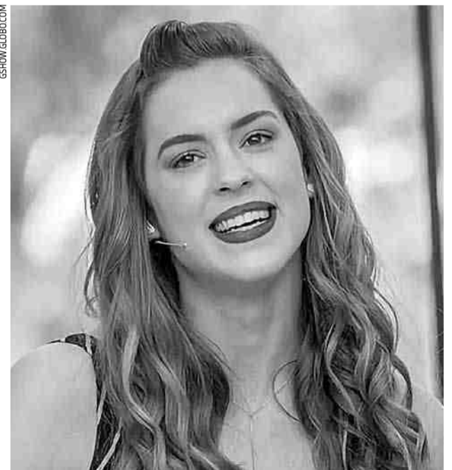
A atriz, cantora e apresentadora Sophia Abrahão

Quem quiser colaborar com a causa, pode acessar diretamente a plataforma www.combatecovid.org/hfsa . Mais informações pelo telefone (12) 3954-2422 ou pelo e-mail amigodavida@hfsa.org.br .