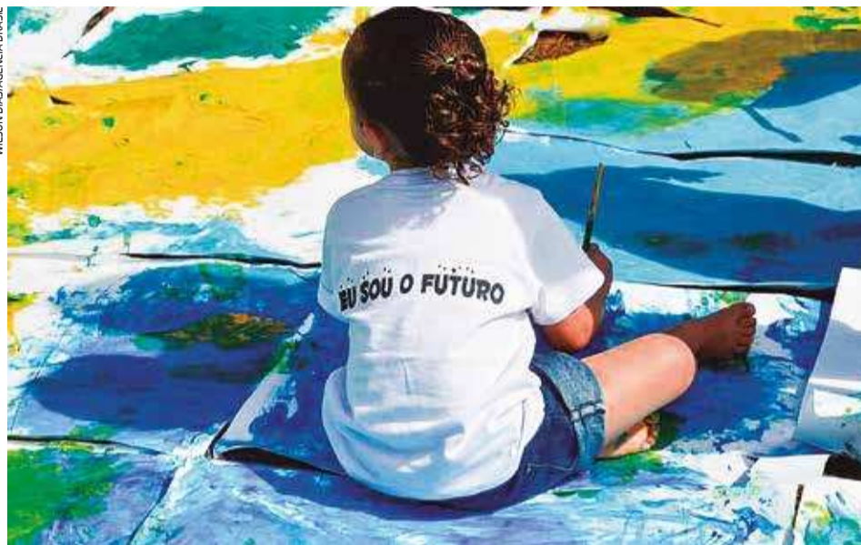
Para especialista, é importante também ampliar o diálogo e explicar a situação