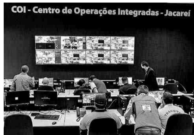
Central do COI em funcionamento na sede Guarda Civil