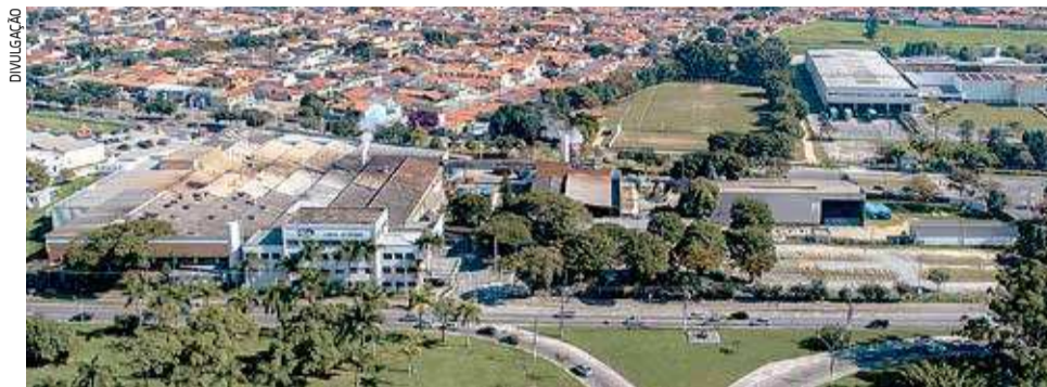
Vista área do complexo da Gates do Brasil, que possui duas fábricas em Jacaré

A empresa, fornecedora de soluções para transmissão de energia, sediada em Denver, nos Estados Unidos, tem duas fábricas no município. O