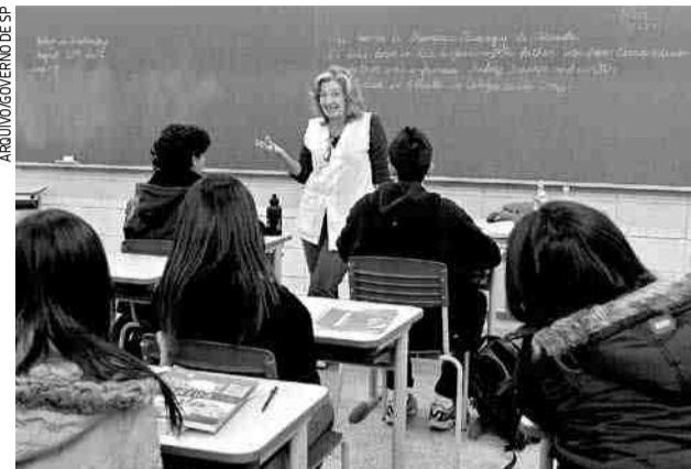
Volta às aulas presenciais ainda não tem data definida

O Estado não comentou o assunto, mas os números estariam ligados diretamente à crise econômica provocada pela pandemia de Covid-19 no país, que provocou queda na economia e