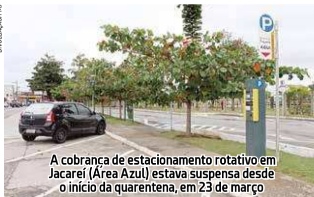
A cobrança de estacionamento rotativo em Jacaré (Área Azul) estava suspensa desde o início da quarentena, em 23 de março