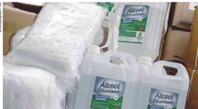
Álcool e máscaras para a rede municipal de saúde

A Prefeitura de Jacaré recebeu novas doações, destinadas à Secretaria de Saúde, que serão utilizadas na rede pública municipal.