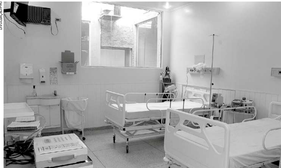
A unidade será um centro de recuperação para os pacientes diagnosticados com a Covid-19, atuando no tratamento de casos sem gravidade

A estrutura inicial conta com 10 leitos intermediários, equipados para um atendimento especializado aos munícipes. Desses leitos, três estão preparados com suportes ventilatórios para atender pacientes com dificuldade respiratória. Além disso, há duas ambulâncias e um aparelho de Raio-X. Caso a demanda de atendimento aumente, o