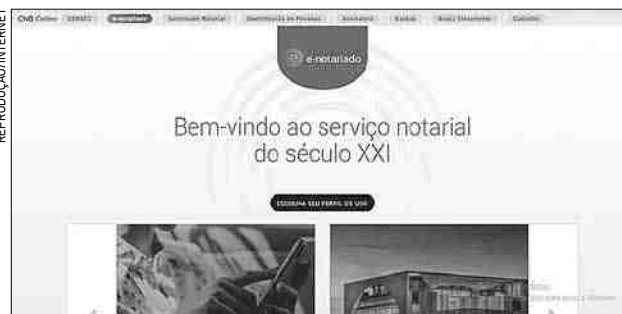
Plataforma e-Notariado, desenvolvida pelo Colégio Notarial

Publicado pela Corregedoria Nacional de Justiça do Conselho Nacional de Justiça (CNJ), órgão fiscalizador dos serviços dos cartórios, dispõe sobre a realização de atos notariais eletrônicos à distância utilizando a plataforma e-Notariado (www.e-notariado.org.br), desenvolvida e administrada