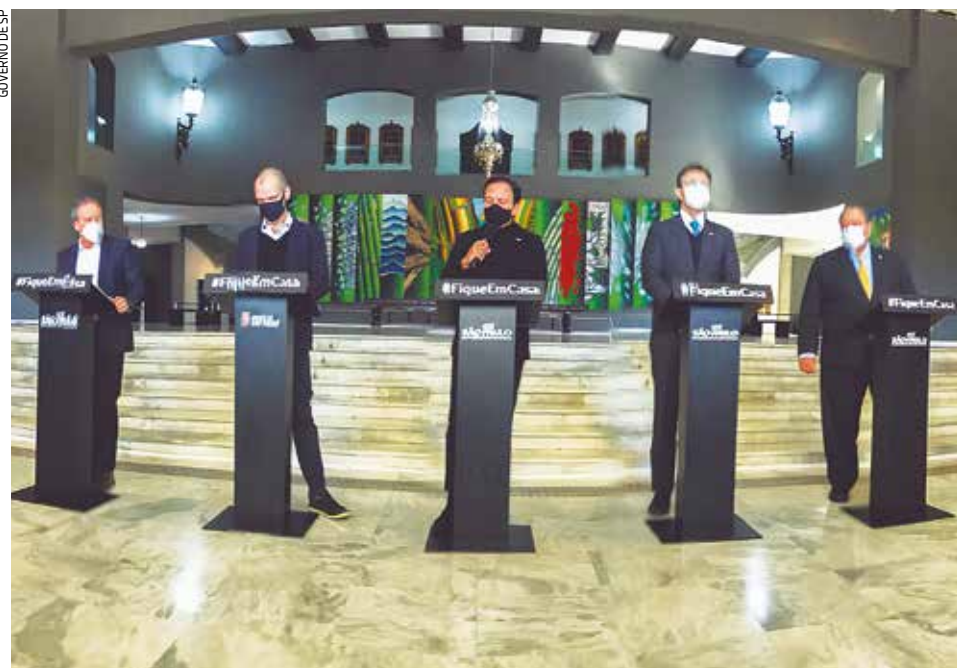
O governador João Doria e autoridades estaduais durante coletiva no Palácio dos Bandeirantes

O documento segue diretrizes do Governo de SP, que autorizam prefeitos a conduzir ações em suas cidades