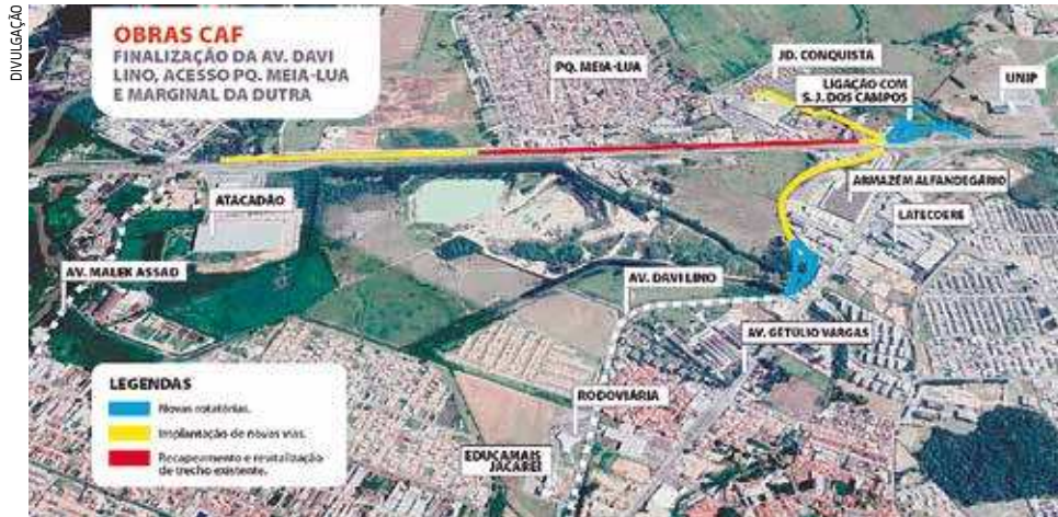
Ilustração apresenta detalhes da obra de prolongamento da Avenida Davi Lino

conjunto de obras e intervenções previstas no Programa de Desenvolvimento Urbano e Social de Jacareí (PRODUS), financiado com recursos do contrato de financiamento entre o Município e a Corporação Andina de Fomento (CAF), num total de