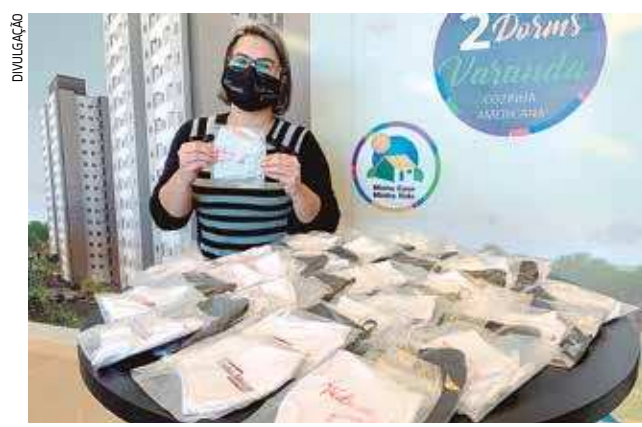
O ponto de distribuição das máscaras fica no Residencial Dumont, na avenida Getúlio Vargas, em frente ao Shibata

Para impulsionar a campanha, a construtora fez uma doação inicial de quatro toneladas de alimentos para as secretarias de assistência social de Jacareí e Suzano, cidade onde também foi montado um ponto de arrecadação.