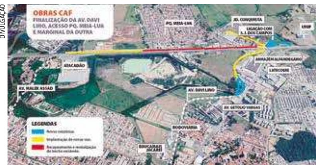
Detalhes da obra de prolongamento da Avenida Davi Lino