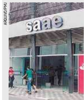
Sede administrativa do SAAE na região central