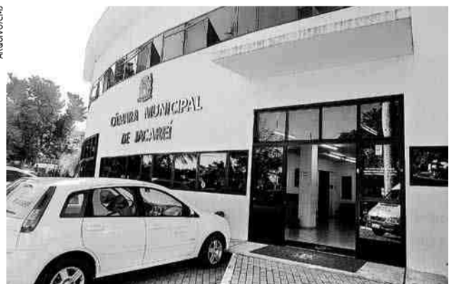
O atendimento ao público será feito somente mediante agendamento prévio, sob a responsabilidade de cada gabinete