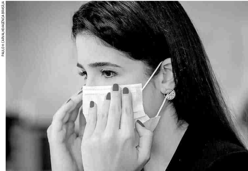
De acordo com o Decreto da prefeitura, fica proibido o ingresso de pessoa física, em qualquer ambiente com atendimento ao público em Jacareí, sem o uso de máscara facial protetora

Também a partir de 11 de maio, o uso de máscaras será obrigatório em veículos de transporte coletivo de passageiros, táxis