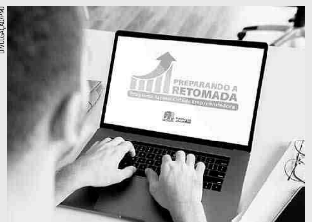
Os encontros no ambiente virtual serão sempre às 18h30, com previsão de uma hora de duração

Na quinta-feira (7), o tema será "Estratégias de curto prazo para a geração de caixa". E, finalizando, na sexta-feira (8), o tema proposto é "Estratégias para nova tendência do varejo".