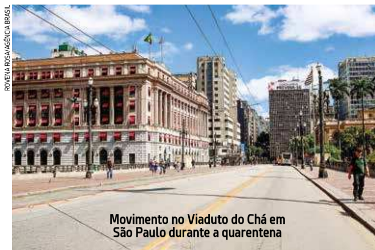
Movimento no Viaduto do Chá em São Paulo durante a quarentena

De acordo com o pesquisador, a atual pandemia tem ecos do passado, ou seja, elementos comuns às pandemias antigas, como o pânico e o