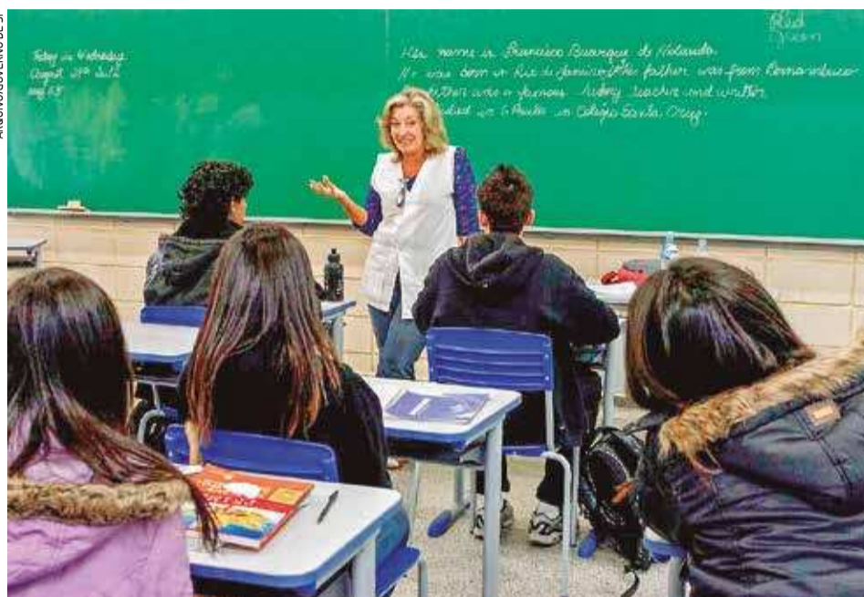
As aulas na rede estadual de São Paulo estão suspensas desde o dia 23 de março

retomada, os alunos serão avaliados sobre eventuais prejuízos de aprendizado durante o período de