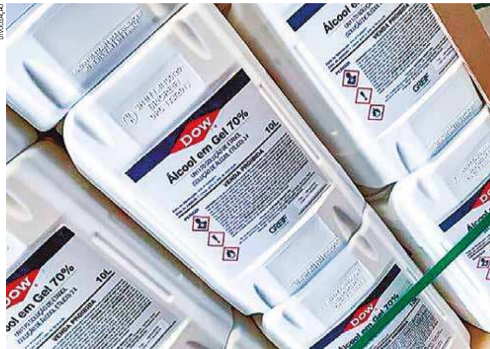
Embalagens de álcool em gel produzido pela Dow para doação na rede pública de saúde

social da empresa frente ao cenário atual da pandemia, momento