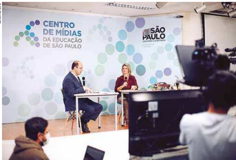
O secretário estadual Rossieli Soares durante aula inaugural do Centro de Mídias

O CMSP conta com dois aplicativos. O CMSP para Ensino Fundamental dos Anos Finais e Ensino Médio e o CMSP Educação Infantil e Anos Iniciais. Os aplicativos estão disponíveis para os