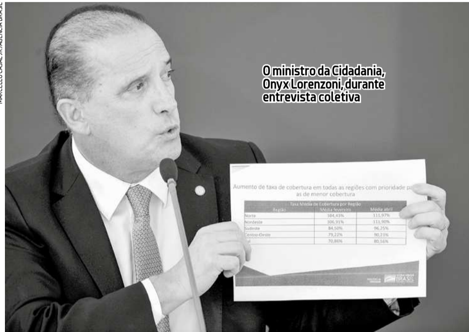
O ministro da Cidadania, Onyx Lorenzoni, durante entrevista coletiva

De acordo com Onyx, após a sanção presidencial, o governo ainda precisa editar um decreto regulamentador e uma medida provisória (MP) abrindo um crédito extraordinário no Orçamento. O pagamento será feito apenas pelas redes dos bancos públicos federais: Caixa Econômica Federal, Banco do Brasil (BB), Banco da Amazônia (Basa) e Banco