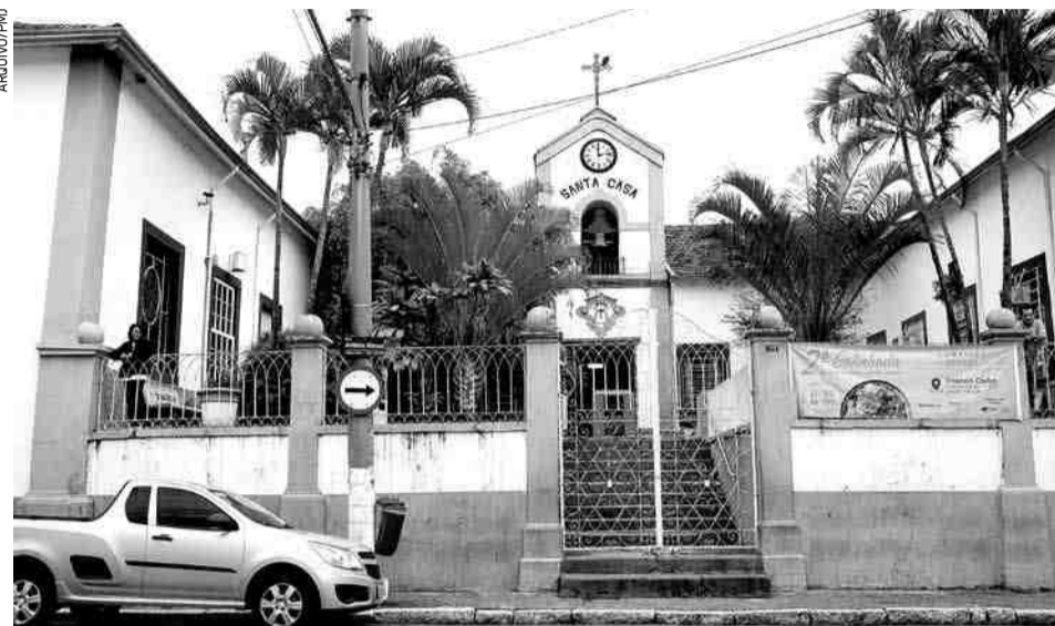
Vista externa da Santa Casa de Misericórdia, único hospital público de Jacareí

de UTI na cidade se dividem entre o Hospital São Francisco (20) e a Santa Casa de Misericórdia (8), único hospital público da cidade.