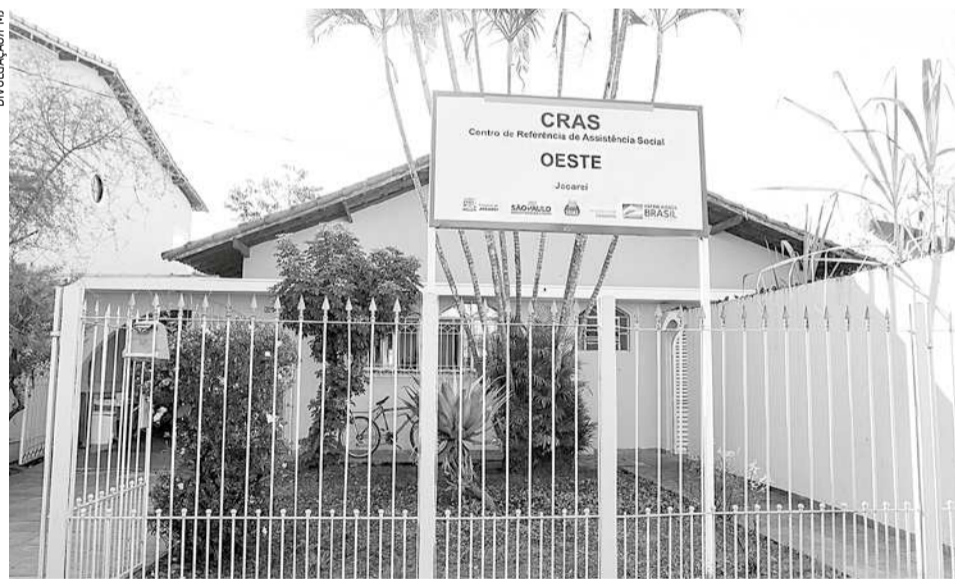
Prefeitura orienta população a não procurar unidades do CRAS em Jacareí, enquanto as regras não forem estabelecidas pelo Governo, através do Ministério da Cidadania

Para esclarecimento de dúvidas sobre o Programa Bolsa Família, a Secretaria de Assistência Social de Jacareí mantém duas linhas telefônicas à disposição da população, que são: (12) 992312192 e (12) 991611785.