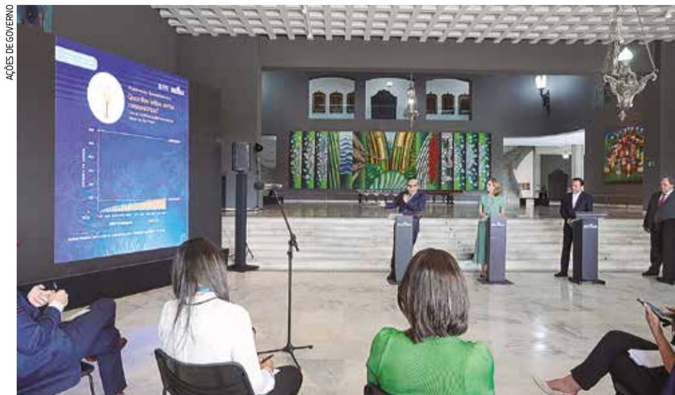
Os resultados foram divulgados na segunda-feira (30), no Palácio dos Bandeirantes