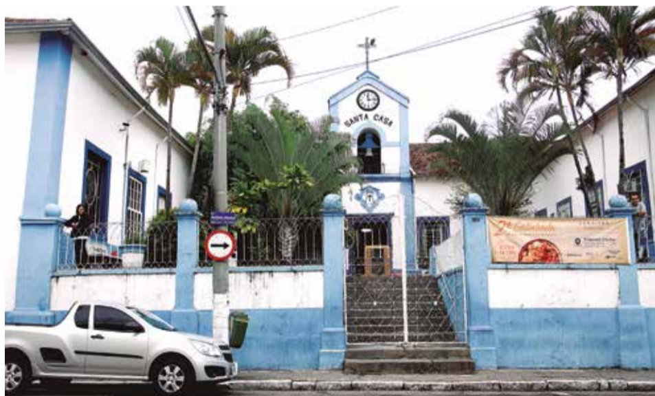
Vista externa da Santa Casa de Misericórdia, único hospital público de Jacareí

✓ Jacareí confirma primeira morte por Covid-19 PÁG. 3