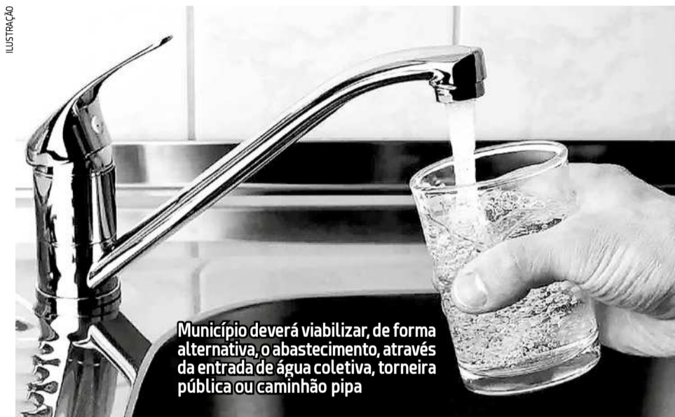
Município deverá viabilizar, de forma alternativa, o abastecimento, através da entrada de água coletiva, torneira pública ou caminhão pipa

A decisão, assinada pela Juíza Rosângela de Cássia Pires Monteiro, da Vara da Fazenda Pública de Jacareí, atende aos pedidos feitos pela Defensoria em uma ação civil pública, através do Defensor Bruno Miragaia, responsável pela ação.