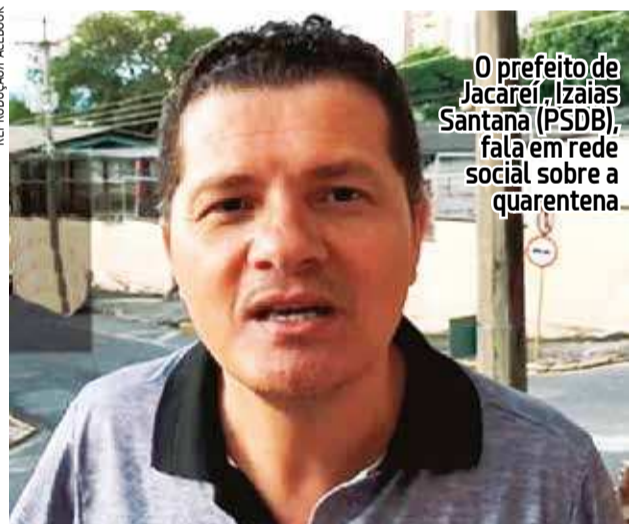
O prefeito de Jacareí, Izaias Santana (PSDB), fala em rede social sobre a quarentena