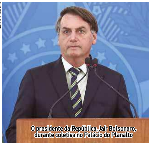
O presidente da República, Jair Bolsonaro, durante coletiva no Palácio do Planalto

Ao contratar o crédito, a empresa assume