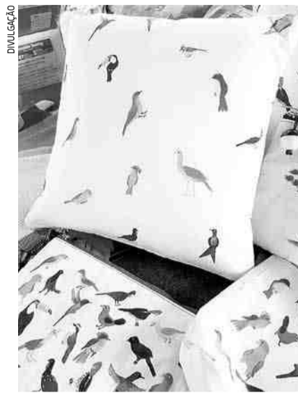
Produtos produzidos pelo Projeto 'Mãos que Valem', com apoio da Suzano

Os artesãos fazem jus à homenagem deste mês, pois já expuseram seus produtos no Instituto Tomie Ohtake, em São Paulo, e outras