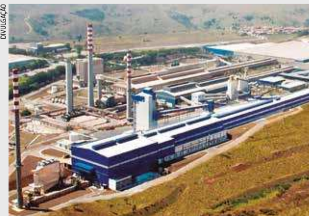
Vista geral da fábrica da Cebrace em Jacareí

antecipação do período de quarentena para a partir dessa data, o prefeito de Jacareí disse que a mensagem principal é para que as pessoas