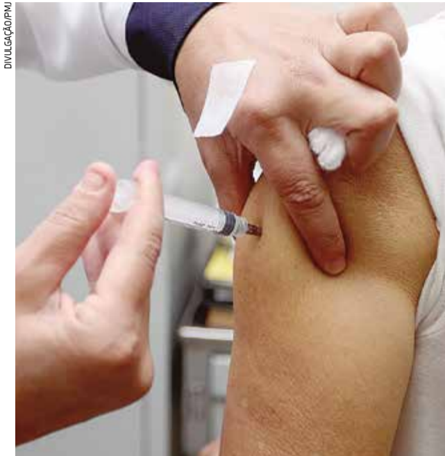
Equipes do programa 'Saúde da Família' agendarão a vacinação do idoso a domicílio, ao longo desta primeira fase da campanha

Os funcionários da Secretaria pedem a colaboração dos idosos e de seus familiares para que