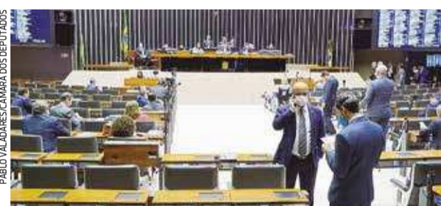
Presidente Rodrigo Maia (ao fundo), conduziu sessão virtual da Casa, que contou com poucos deputados no Plenário

Os trabalhadores deverão cumprir alguns critérios, em conjunto, para ter direito ao auxílio: ser maior de 18 anos de idade; não ter emprego formal; não receber benefício previdenciário ou assistencial, seguro-desemprego ou de outro programa de transferência de renda federal que não seja o Bolsa Família; renda familiar mensal per capita (por pessoa