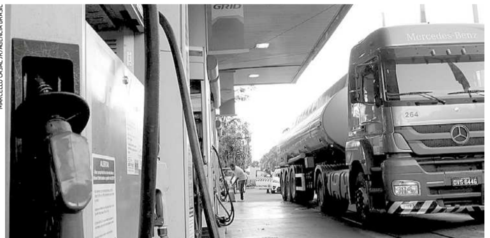
Os revendedores passam a funcionar, no mínimo, de segunda a sábado, das 7h às 19h

o cuidado com a garantia do abastecimento nacional e flexibilizam algumas obrigações, entre elas o horário de funcionamento dos postos de combustíveis", informou a agência.