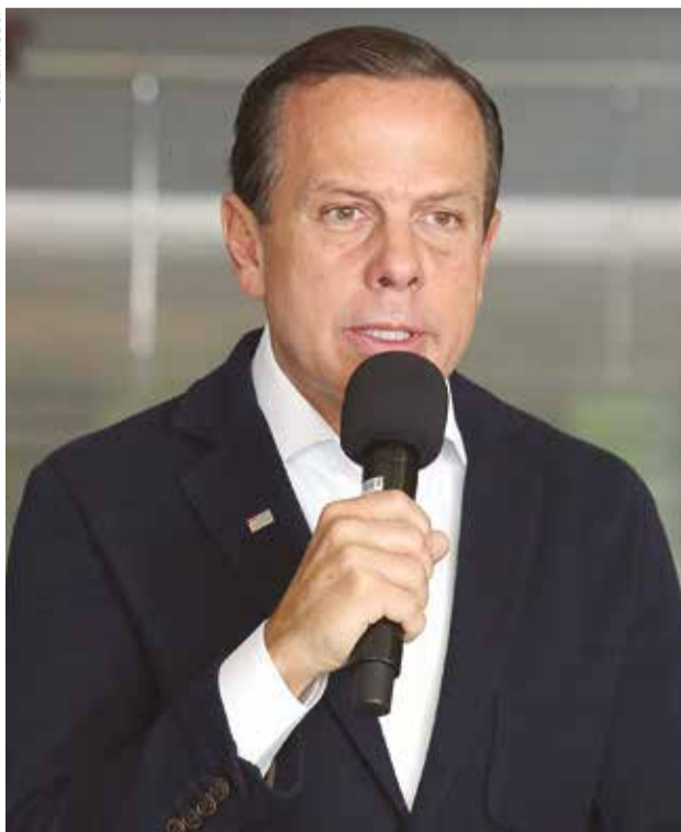
O Governador João Doria, durante entrevista coletiva

Só ficarão abertos estabelecimentos com atendimento presencial que prestam serviços considerados essenciais – a quarentena não afeta o funcionamento de indústrias. O decreto assinado