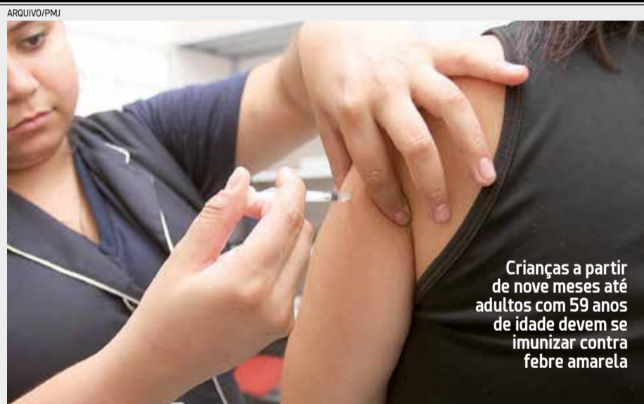
Crianças a partir de nove meses até adultos com 59 anos de idade devem se imunizar contra febre amarela

Fonte: Texto da Dra. Michelle Samora, com a colaboração da Dra. Marcela Bonalumi, ambas oncologistas do Centro Paulista de Oncologia (CPO) -- unidade Oncoclínicas em São Paulo