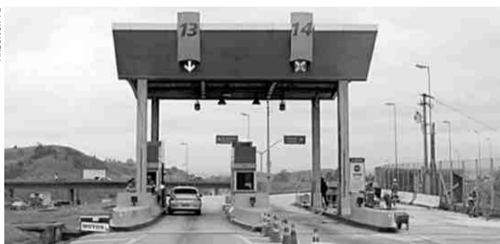
Cabine avançada de pedágio na região do bairro Nova Jacareí