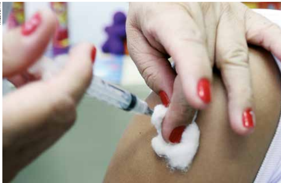
A vacinação contra o HPV representa a melhor forma de prevenção primária

Aproximadamente 90% dos casos ocorrem em países pobres ou emergentes, sobretudo por estratégias de implementação vacinal e programas de rastreamento populacional inadequados. A mortalidade nesses países é cerca de 18 vezes maior que em países desenvolvidos. No Brasil, a taxa de mortalidade ajustada para a população mundial de 4,70 óbitos para