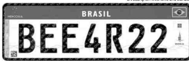
Nova placa de veículos, padrão Mercosul

do Mercosul em todos os estados do país. O prazo atende ao estipulado na Resolução nº 780/2019 do Conselho Nacional de Trânsito (Contran), de julho do ano passado, que determina que as unidades