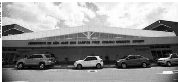
Os meses de maior fluxo no aeroporto foram janeiro e julho, com 35.421 e 31.628 viajantes, respectivamente

A movimentação de aeronaves também cresceu no período. Foram 861 pousos e decolagens, o que representa um aumento de 11,2% ante as