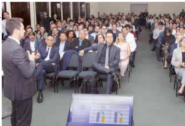
Público presente à terceira audiência sobre a nova concessão da Via Dutra, realizada no último dia 17, em São Paulo

APÓS GOLPE DO FALSO SEQUESTRO, SECRETÁRIA DE SEGURANÇA ORIENTA MUNICÍPE DE JACAREÍ PG. 4