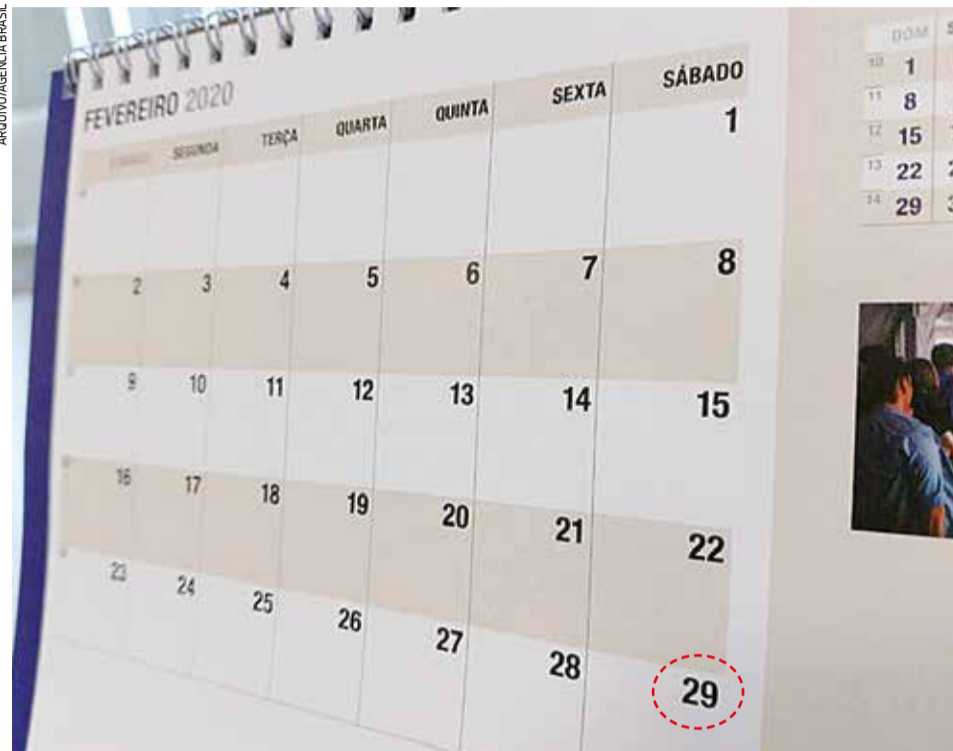
As pessoas nascidas nesta data devem ter o dia exato na certidão de nascimento

O ano bissexto foi criado pelos romanos na época do imperador Júlio César para adequar o calendário ao tempo que a Terra leva para dar uma volta completa em torno do Sol. A translação (volta ao redor do Sol) não é feita em exatos 365 dias, mas sim em 365 dias, cinco horas, 48 minutos e 46 segundos. Essa fração de tempo é arredondada para seis horas e é compensada no ano bissexto, já que seis horas, em quatro