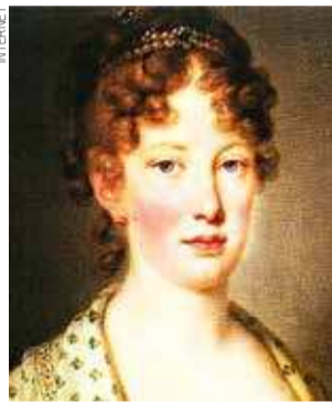
D. Leopoldina, a sonhadora

Um livro para comprar, ler e enriquecer a biblioteca. Afinal, não gastarão os séculos a memória da amada Imperatriz, como bem registra sua lápide. Mais uma obra sensacional. Leia!