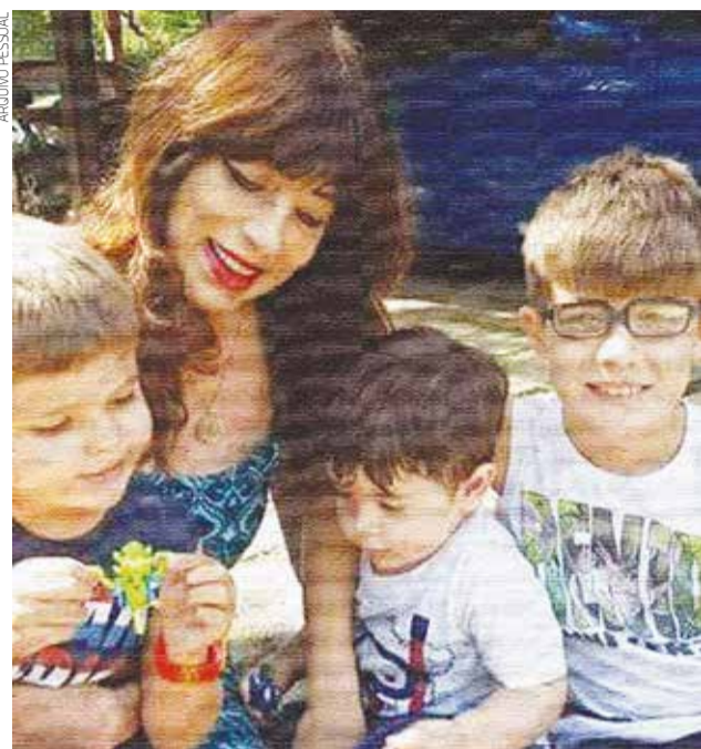
"Cabe a cada um de nós concluir qual será a sua verdade"

Não foi uma e nem duas vezes que somente pensar em algo, gerava o fato imediatamente acontecendo. Tenho certeza que você leitor também já teve algumas, e quem sabe várias experiências assim. Vamos a alguns exemplos mais corriqueiros: pensar em alguém e de repente um