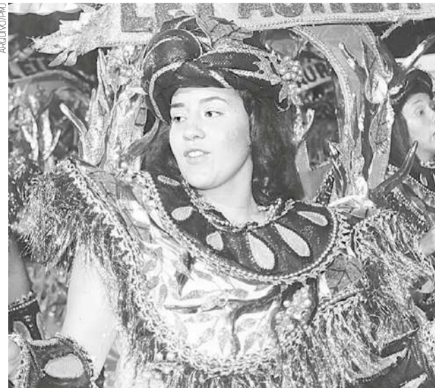
Integrante da Estrela Cadente, campeã do Carnaval em 2018

Os participantes deverão registrar imagens do desfile das escolas de