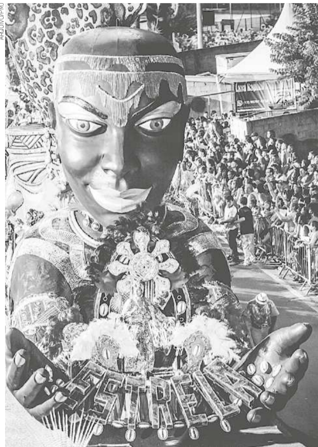
Carro Alegórico da Estrela Cadente, tricampeã do Carnaval