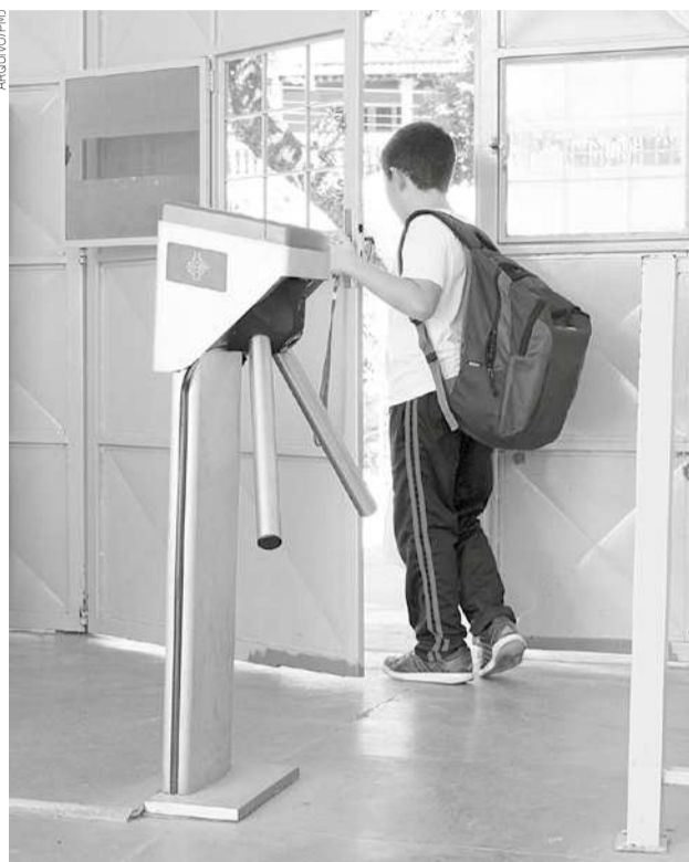
Catraca para controle de acesso de aluno instalada em escola da rede municipal de Jacaré

Na ocasião, a primeira auditoria investigou denúncia de irregularidades no processo de licitação, ao constatar que duas empresas inscritas pertenciam, possivelmente, ao mesmo dono, o que atrapalhou a