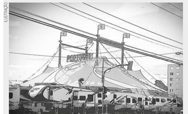
O moderno circo Portugal trouxe antigas lembranças

Mas, uma coisa se confirmou nas lembranças da Telê: o circo de lona que não segura chuva, de jogo de luzes mágicas (“a cabeça da moça fica separada do corpo e os dois se mexendo!”) possui a magia que jamais acaba, com os mesmos palhaços os mesmos trapezistas e os mesmos encantadores de nós crianças de todos os tempos.