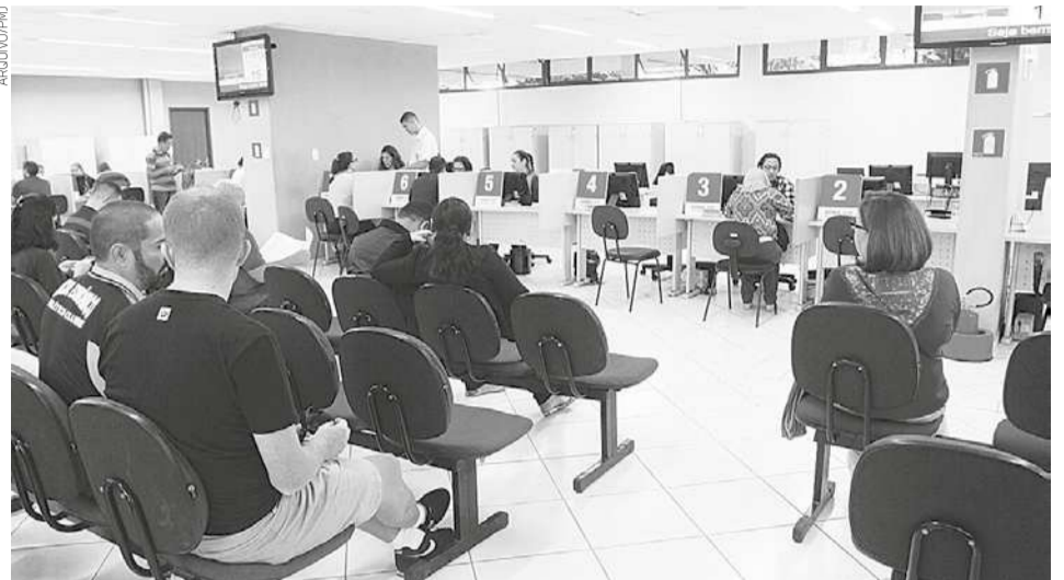
A suspensão da cobrança será feita mediante protocolo de pedido de revisão no AtendeBem

A suspensão da cobrança será feita mediante protocolo de pedido de revisão. O contribuinte deverá comparecer ao AtendeBem (no Paço Municipal) até o dia 29 de março, munido de requerimento padrão (solicitado pelo e-mail atendebem@jacarei.sp.gov.br ) e cópia da licença urbanística, no caso de construção. Se os carnês do IPTU e da taxa