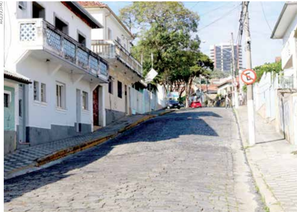
A rua Francisco Theodoro (Centro) será uma das vias contempladas com asfalto em Jacareí

O convênio assinado com Jacareí prevê o repasse de R$ 4 milhões para obras de pavimentação de 13 ruas,