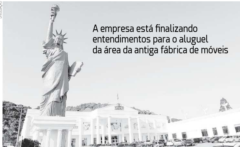
Sede do Grupo Havan na cidade de Brusque, em Santa Catarina

A empresa está finalizando entendimentos para o aluguel da área da antiga fábrica de móveis