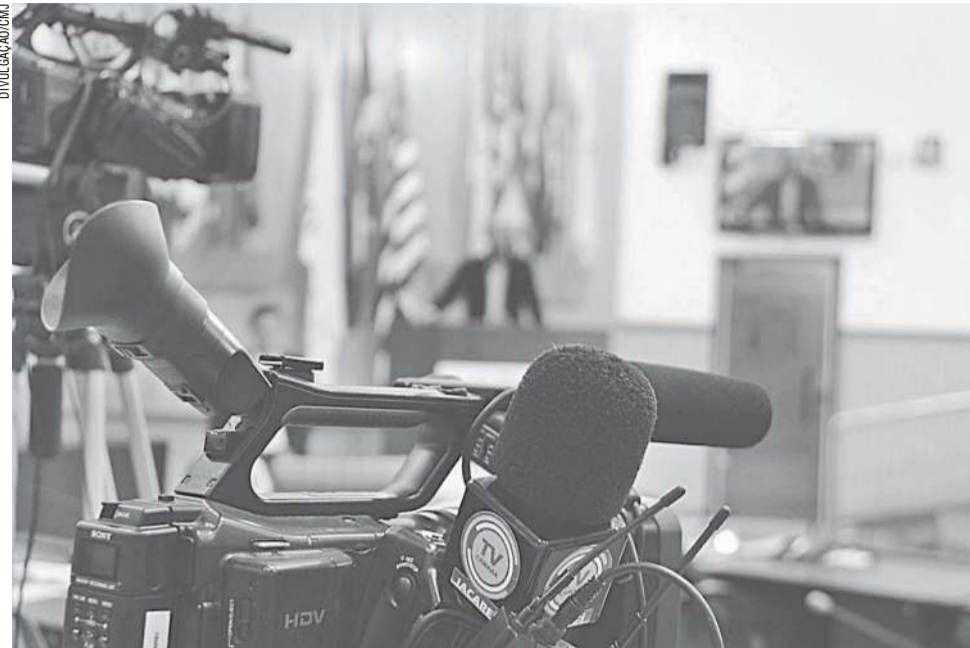
Modernizada e 100% digitalizada, a TV Câmara Jacaré completa oito anos nesta quinta-feira (28)

A nova tecnologia digital, que está presente na Central Técnica da TV e foi adquirida no final de março, segue uma tendência das emissoras do País, estimulada pela decisão do Ministério das Comunicações em desligar o sinal de TV analógico nacional-