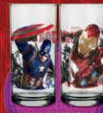
BRINDE DA SEMANA

PROMOÇÃO EXCLUSIVA PARA OS MEMBROS DO CINEMARK MANIA.