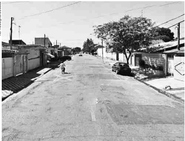
Rua do Jardim Santa Maria, na região norte de Jacaré, onde casa de jovem foi roubada por ladrões, no domingo (1º)

um dos elementos é um homem branco, aparentando ter 1,68m de altura, magro, com tatuagem na mão, usava boné preto, bermuda, blusa preta e estava armado com um revólver; o outro indivíduo é moreno, alto, utilizava blusa com touca, bermuda e moletom vermelho; ambos estavam de chinelos.