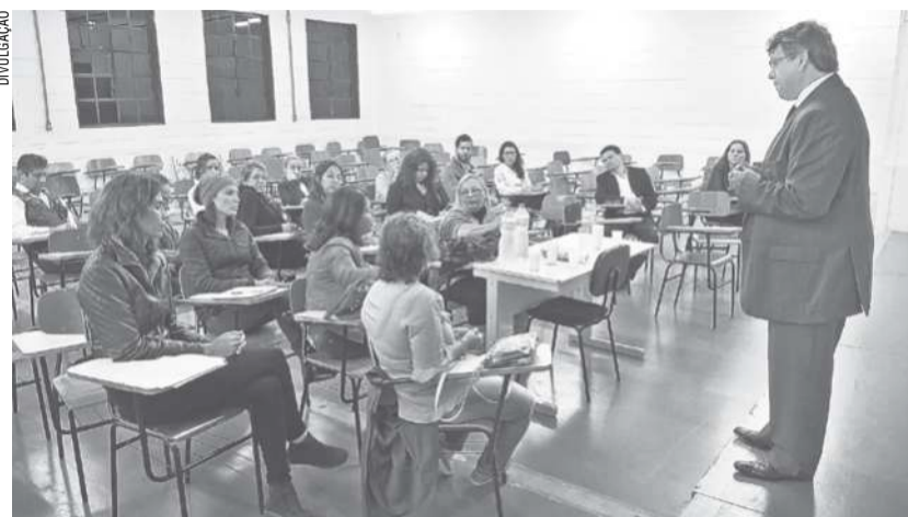
O deputado estadual Padre Afonso (PV), durante encontro em Jacareí para discutir proteção animal na cidade

Will informou que 'sem ajuda do poder público local, as ONGs vem trabalhando arduamente em campanhas de conscientização, castração de animais e controle de doenças. Tudo