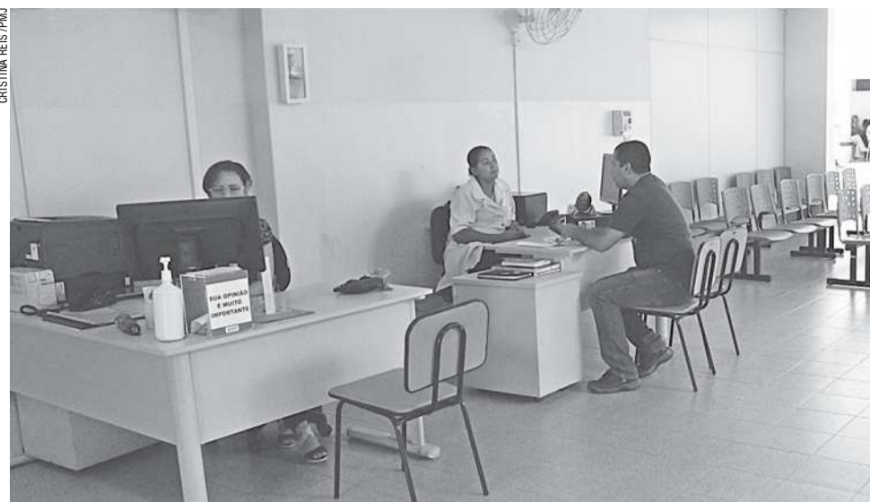
O atendimento, que ocorria de segunda a sexta-feira das 7h às 17h, será feito 24 horas por dia

Jacaré obteve a qualificação do local para a categoria CAPS AD III. Deste modo, o atendimento, que ocorria de segunda a sexta-feira das 7h às 17h, será feito 24 horas por dia, inclusive nos feriados e finais de semana. O local realiza atendimento de pessoas com