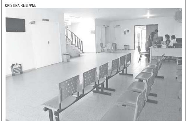
Vista interna da nova unidade do CAPS AD Jacaré

A permanência de um mesmo paciente no acolhimento noturno do CAPS AD III fica limitada a 14 dias. Caso seja necessário um período superior, a pessoa é encaminhada à Casa de Passagem.