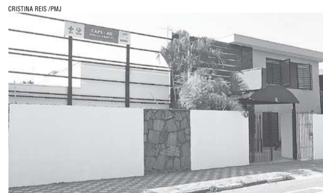
Atualmente, a unidade está localizada na avenida Major Acácio Ferreira, 620, no Jardim Leonídia