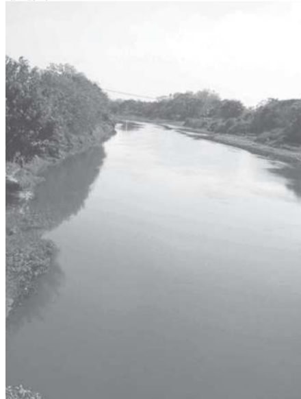
Trecho do Rio Paraíba do Sul, em Jacareí; nível das águas da bacia estava em 43,90% no dia 6 de abril

Mas, após as chuvas os dois reservatórios elevaram seus índices. O nível da bacia estava em 2,17% no dia 9 de fevereiro de