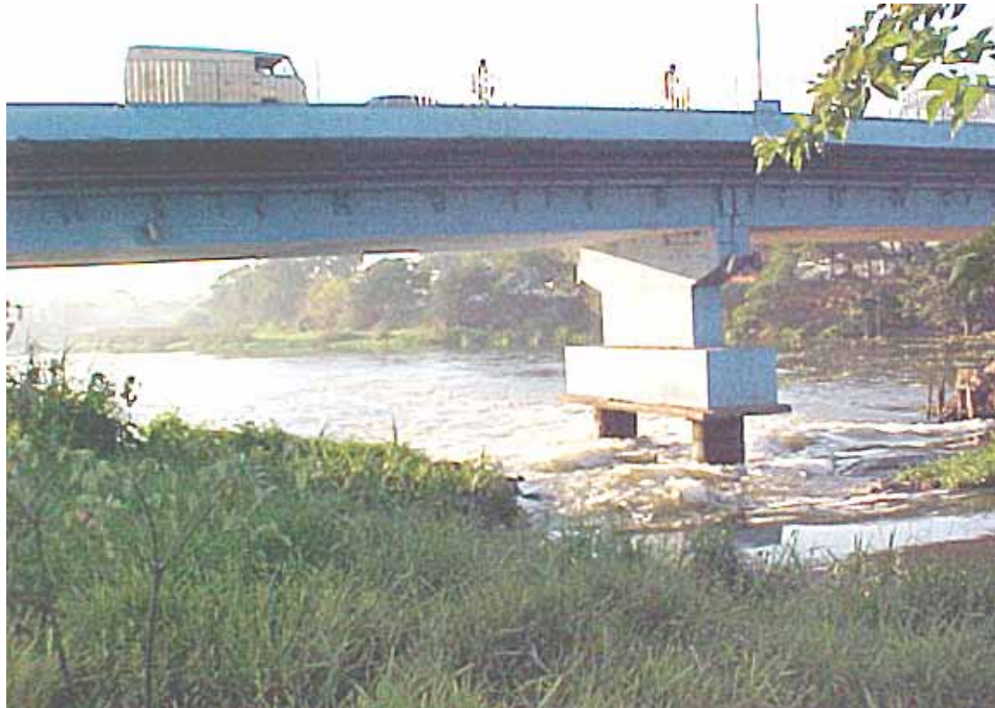
Entre os trabalhos de pintura e desenho, está a ponte sobre o rio Paraíba, em Jacareí

A exposição é composta por 28 trabalhos em desenho e pintura, realizados por moradores de cidades do interior de SP