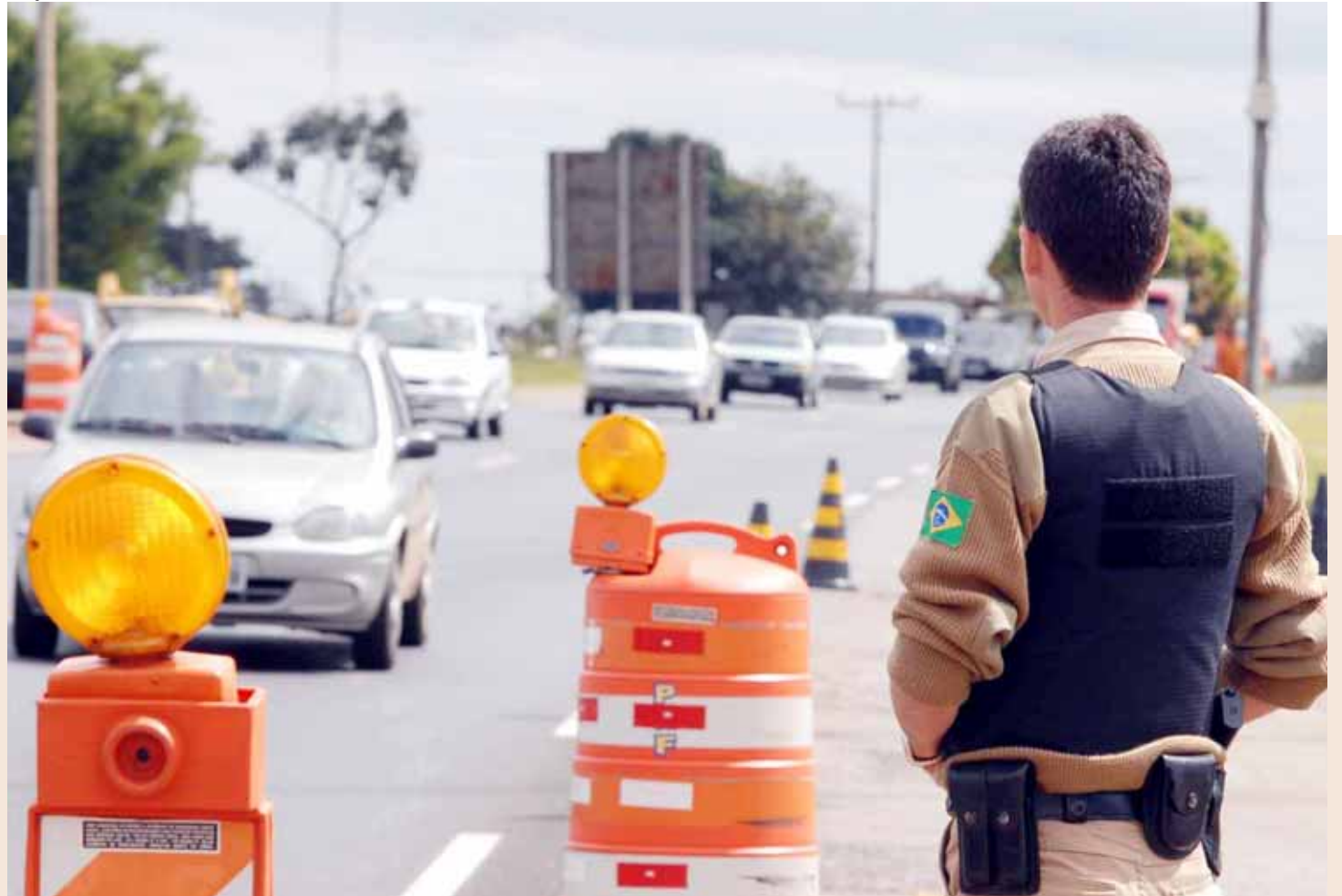
Para a polícia, a queda do número de mortes e acidentes foi em decorrência ao aumento da fiscalização