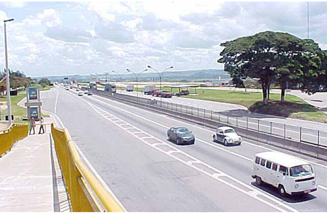
O acidente aconteceu na altura do Km 157 da Via Dutra, trecho de São José dos Campos