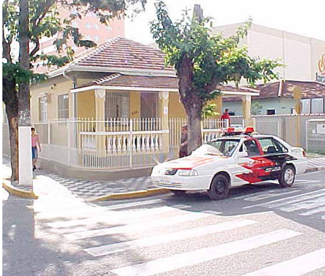
O caso está sendo investigado na DDM de Jacareí- Delegacia de Defesa da Mulher