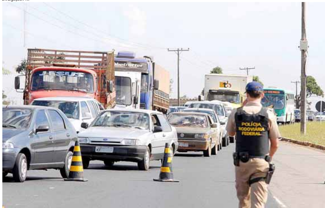
Para a polícia, a queda do número de mortes e acidentes foi em decorrência ao aumento da fiscalização