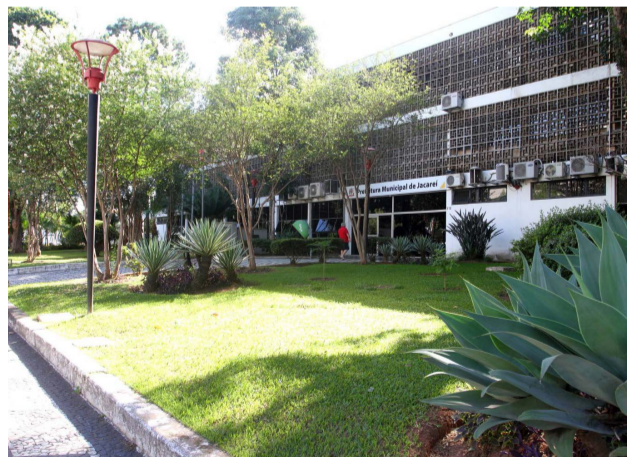
Vista externa da sede da Prefeitura de Jacareí

O plenário da Câmara Municipal aprovou, por unanimidade, na sessão desta quinta-feira (30), projeto de lei que cria o Domicílio Tributário Eletrônico (DTE) em Jacareí.