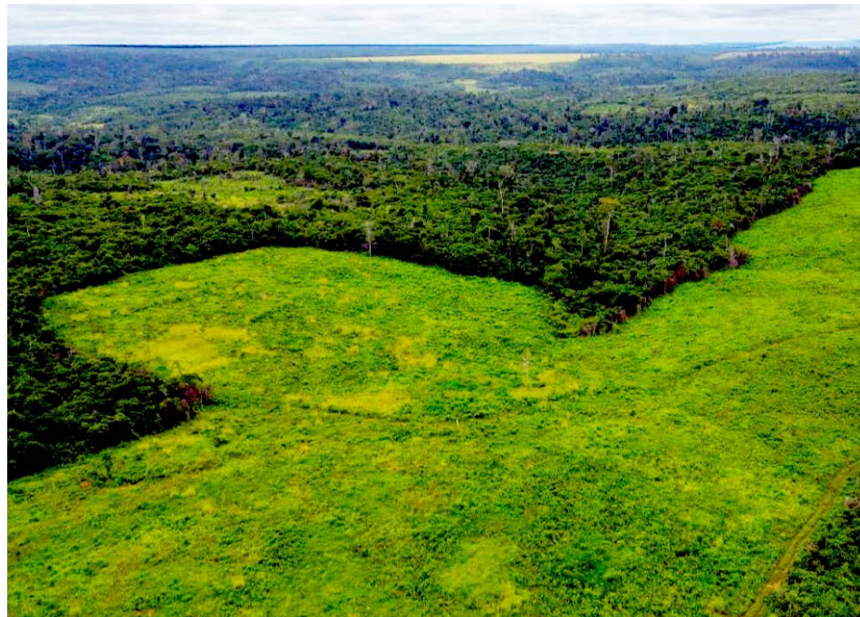
Iniciativa viabilizará a recuperação de áreas nos biomas Cerrado, Mata Atlântica e Amazônia

Trata-se do maior volume de recursos já aprovados com recursos do Fundo Clima para a recuperação de mata nativa degradada no Brasil. O termo de aprovação do financiamento foi entregue no último dia 10, pelo presidente do BNDES, Aloizio Mercadante, à vice-presidente executiva de Sustentabilidade,