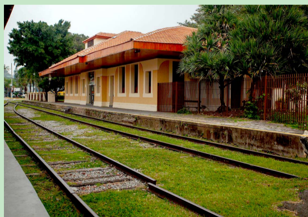
A antiga Estação de Trem de Jacareí, na região central da cidade, também está retratada no livro

As transformações pelas quais a região passou são o foco principal do livro ‘Vale do Paraíba: natureza, cultura e sustentabilidade’. A publicação contou com patrocínio da BASF, apoio da Fundação Eco+ e realização da Horizonte Educação e Comunicação por meio da Lei Federal de Incentivo à Cultura. Os textos são do jornalista Luís Patriani, fotografias de Leandro Cagiano e coordenação