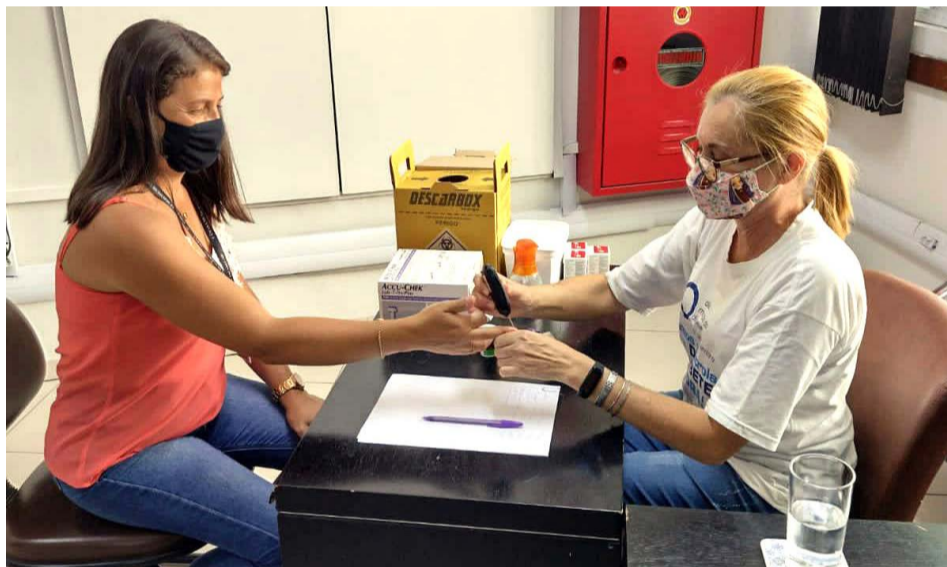
A ação contempla verificação de glicemia capilar e orientação médica, ente outros

A ação contempla verificação de glicemia capilar, aferição de pressão arterial, orientações nutricionais, atendimento e